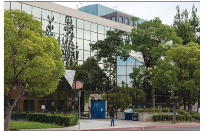
Nhiều sai phạm của ECS bị lên án