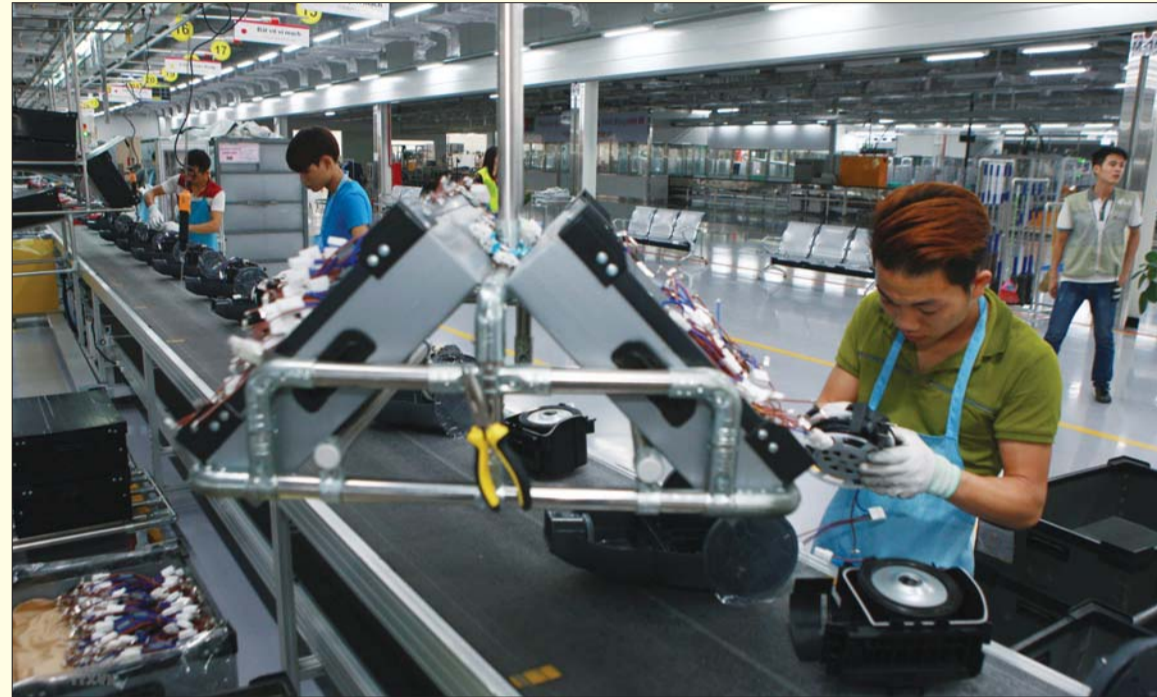
Cần phải có chính sách ưu đãi cho các DN trong nước tham gia FTA