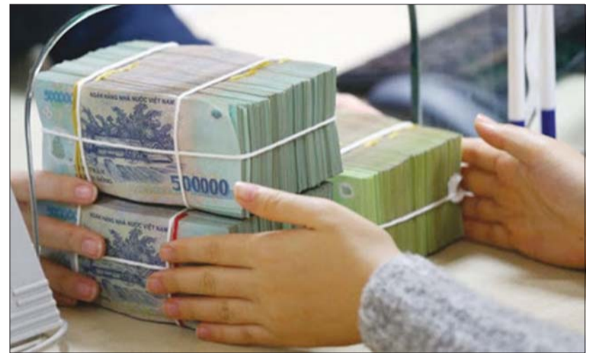
Thâm hụt ngân sách tăng mạnh trong 9 tháng qua Ảnh minh họa

Nhằm ứng phó với những tác động tiêu cực của dịch Covid-19, Bộ trưởng Bộ Tài chính Đinh Tiến Dũng cho biết, Bộ đã chủ động xây dựng phương án điều hành thu, chi NSNN; chỉ đạo tăng cường công tác quản lý thu, chống thất thu, chống buôn lậu, gian lận thương