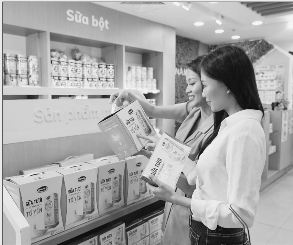
Các sản phẩm mới của Vinamilk được người tiêu dùng đón nhận tích cực

Bên cạnh các hoạt động hỗ trợ cộng đồng tích cực và kịp thời trong đại dịch