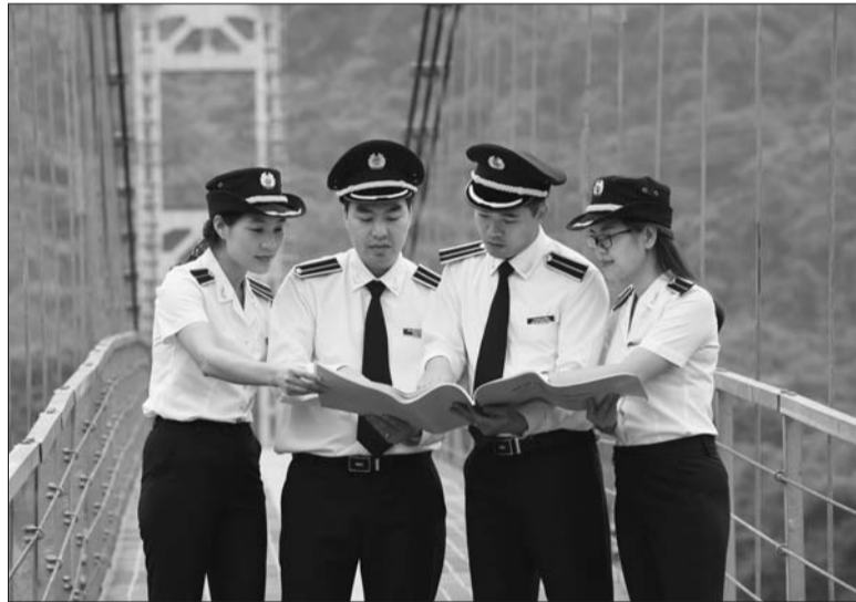
KTNN chỉ rõ, thu NSNN năm 2018 vượt dự toán giao song cơ cấu thu chuyển dịch chậm, nhiều khoản thu không đạt mục tiêu đặt ra