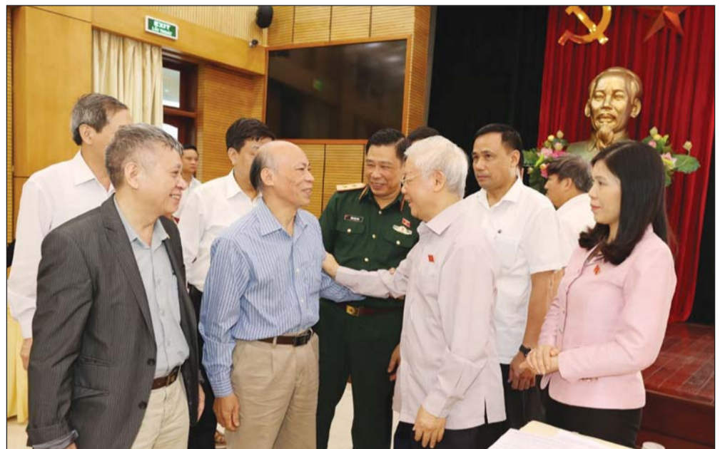
Tổng Bí thư, Chủ tịch nước Nguyễn Phú Trọng tiếp xúc cử tri quận Hoàn Kiếm, Ba Đình và Tây Hồ