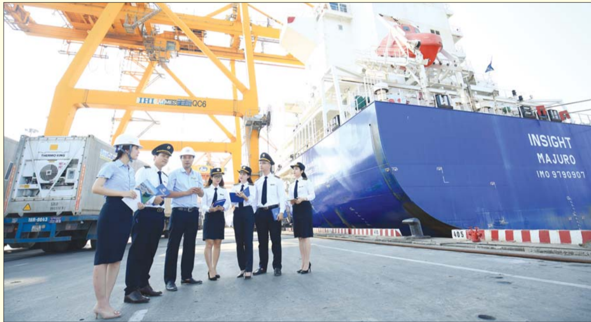
Các cuộc kiểm toán được thực hiện đúng tiến độ, đảm bảo chất lượng đã đề ra

Thời gian qua, mặc dù vừa phải thực hiện nhiệm vụ kiểm toán nhưng vẫn phải chấp hành các quy định về phòng, chống dịch bệnh Covid-19, song dưới sự lãnh đạo, chỉ đạo của Đảng ủy, lãnh đạo KTNN và sự nỗ lực quyết tâm của cán bộ, công chức, viên chức và người lao động, toàn Ngành đã đạt được nhiều kết quả khả quan, trong đó nổi bật là công tác kiểm toán.