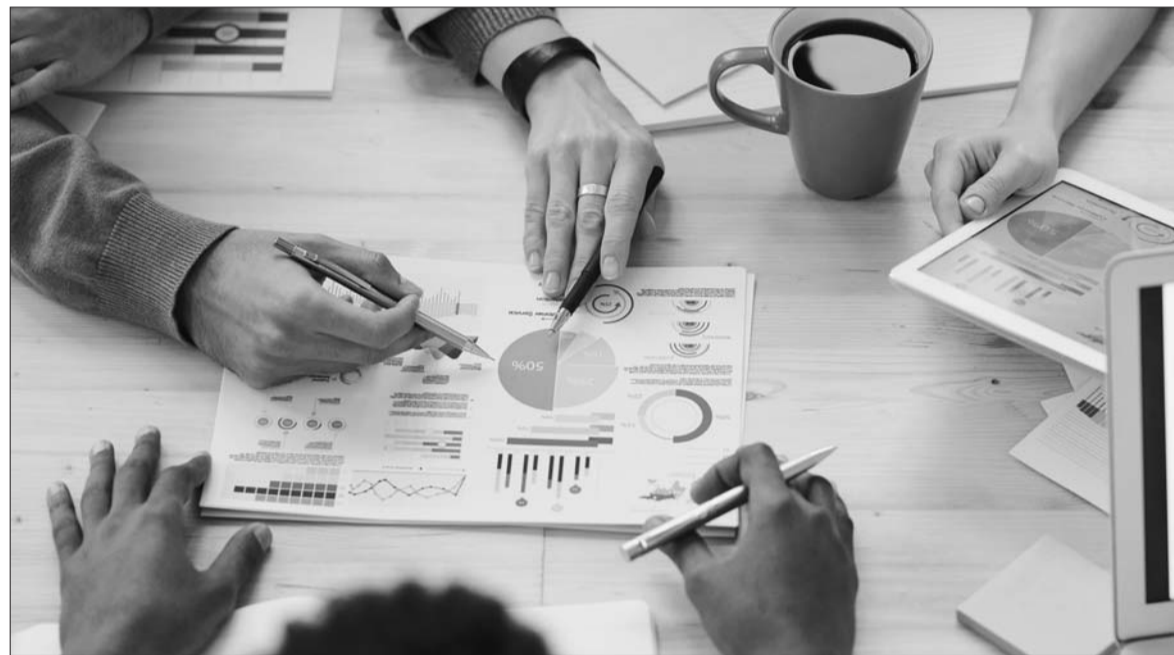
Hoạt động giám sát và đánh giá đầu tư được kỳ vọng sẽ chặt chẽ và hiệu quả hơn

Hoạt động giám sát và đánh giá đầu tư được kỳ vọng sẽ chặt chẽ và hiệu quả hơn khi Chính phủ ban hành Nghị định mới thay thế cho Nghị định số 84/2015/NĐ-CP ngày 30/9/2015 về giám sát và đánh giá đầu tư... - Bộ trưởng Bộ Kế hoạch và Đầu tư (KH&ĐT) Nguyễn Chí Dũng nhấn mạnh.