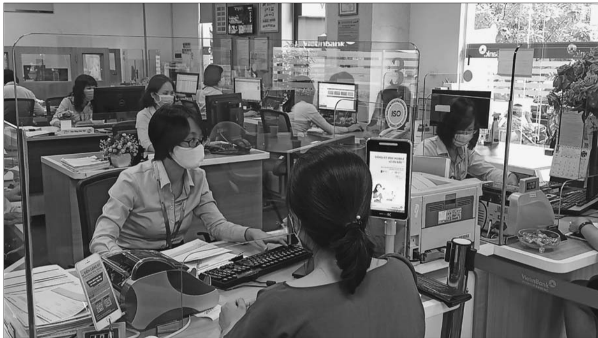
Việc hoàn thiện hành lang pháp lý về xử lý nợ xấu sẽ là tiền đề hình thành thị trường mua bán nợ

Thời điểm kết thúc hành trình cơ cấu lại hệ thống các tổ chức tín dụng (TCTD) gắn với xử lý nợ xấu giai đoạn 2016-2020 đã cận kề. Tuy nhiên, do nhiều nguyên nhân, một số mục tiêu, trong đó có việc kiểm soát tỷ lệ nợ xấu đang đứng trước thách thức khó hoàn thành vào cuối năm nay. Bởi vậy, để có thể về đích tái cơ cấu, ngành ngân hàng vẫn còn nhiều việc phải làm.