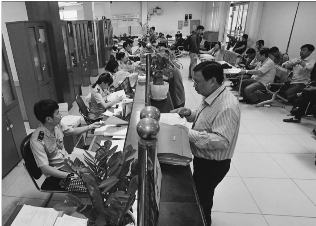
Ngành hải quan tiếp tục đẩy mạnh các giải pháp tạo thuận lợi cho DN để tăng thu NSNN

Phát huy kết quả đạt được trong 9 tháng qua, từ nay đến cuối năm 2020, ngành hải quan tiếp tục triển khai các đề án cải cách thủ tục hành chính, thực hiện nhiều giải pháp tạo thuận lợi thương mại để thúc đẩy hoạt động xuất nhập khẩu, tăng cường công tác chống buôn lậu, phấn đấu thu ngân sách tối thiểu đạt 300.000 tỷ đồng.