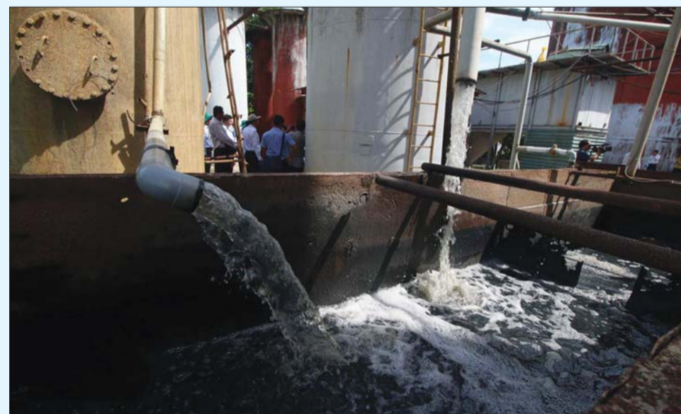
Kết quả thu hút vốn đầu tư vào phát triển ngành CNMT còn thấp Ảnh tư liệu

vực chưa phát triển để đáp ứng yêu cầu bảo vệ môi trường. Kết quả thu hút vốn đầu tư vào phát triển ngành CNMT còn thấp, chưa tương xứng với yêu cầu của xã hội. Lĩnh vực dịch vụ môi trường vẫn chủ yếu dựa vào kinh phí từ nguồn NSNN, nhất là lĩnh vực xử lý nước thải đô thị. Giá dịch vụ môi trường ở mức thấp, ít hấp dẫn nhà đầu tư. Năng lực, sự