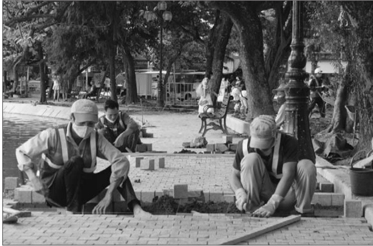
Nhiều lao động bị ảnh hưởng tiêu cực bởi dịch Covid-19