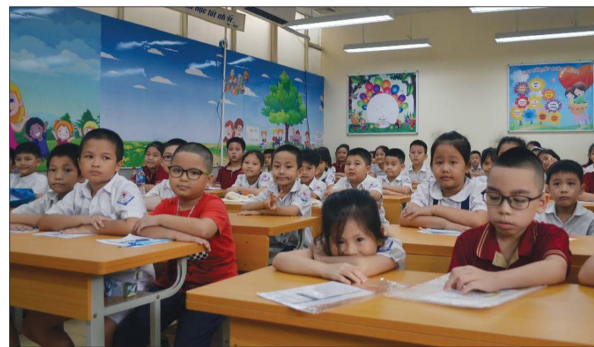
Cần nghiên cứu, tiếp thu những góp ý về SGK lớp 1 mới để điều chỉnh phù hợp hơn