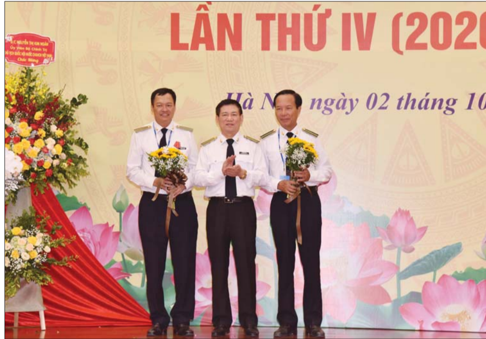
Tổng Kiểm toán Nhà nước Hồ Đức Phớc (đứng giữa) trao tặng Huân chương Lao động hạng Nhì và Ba cho các cá nhân đạt thành tích xuất sắc của KTNN

Trong giai đoạn vừa qua, dưới sự lãnh đạo của Đảng ủy, lãnh đạo KTNN, phong trào thi đua yêu nước (TĐYN) của KTNN đã có nhiều đổi mới, được triển khai sâu rộng và có sức lan tỏa mạnh mẽ đến từng cán bộ, công chức, viên chức và người lao động trong toàn Ngành. Tinh thần ấy sẽ tiếp tục được phát huy trong phong trào TĐYN giai đoạn 2020-2025, tạo động lực, quyết tâm để KTNN hoàn thành xuất sắc mọi nhiệm vụ được giao.