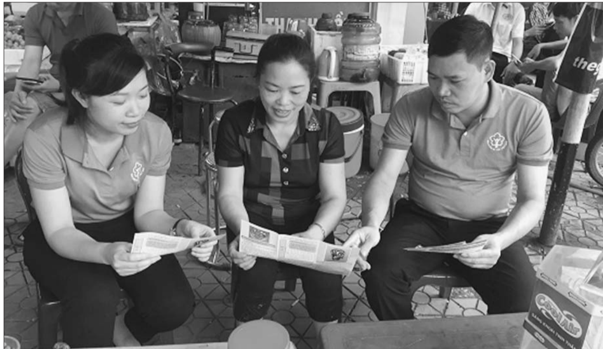
Cán bộ ngành BHXH vận động, tuyên truyền người dân tham gia BHXH, BHYT

Trước tình hình phát triển đối tượng tham gia bảo hiểm xã hội (BHXH) gặp nhiều khó khăn do ảnh hưởng của dịch bệnh Covid-19, ngành BHXH đang nỗ lực bằng nhiều giải pháp đồng bộ, quyết liệt để hoàn thành chỉ tiêu Chính phủ giao.