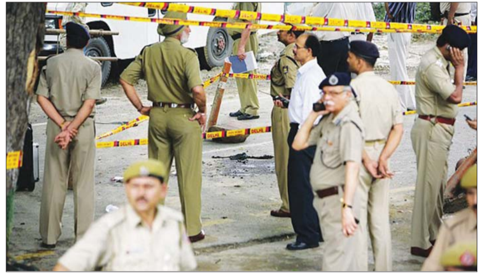
Tỷ lệ tội phạm gia tăng mạnh tại Delhi

Ngoài ra, CAG cũng nhận thấy nhiều vấn đề xoay quanh công tác đấu thầu mua sắm công đối với ứng dụng quản lý hợp thông qua ứng dụng. Khi xem xét các thiết bị trang bị cho cảnh sát, CAG đánh giá rằng hệ thống cấp mạng được sử dụng tại Cơ quan này đã lỗi thời khoảng 20 năm. “Đề xuất nâng cấp hệ thống cấp mạng đã được đưa ra hơn 10 năm trước, song không một nhà thầu nào được chọn. Số lượng các thiết bị không dây giảm từ con số 9.638 vào tháng 6/2009 xuống 6.172 vào tháng 6/2019. Có 3.870 camera đã được lắp đặt tại Delhi, song tỷ lệ các camera hoạt động tốt là rất thấp” - CAG báo cáo.