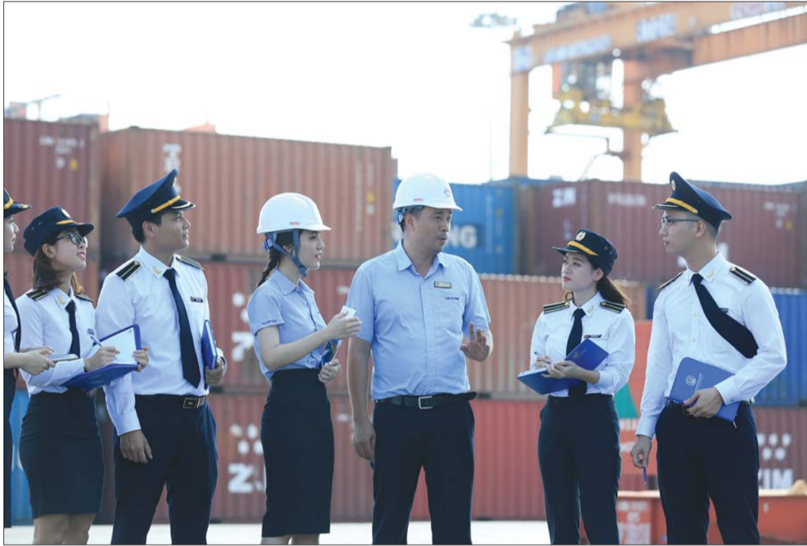
Công tác PCTN trong hoạt động kiểm toán nhà nước đã đạt được kết quả toàn diện

Tổng kết công tác phòng, chống tham nhũng (PCTN) của KTNN từ khi thành lập Ban Chỉ đạo T.Ư về PCTN (ngày 01/02/2013) đến nay, nhất là từ đầu nhiệm kỳ Đại hội XII của Đảng, Bí thư Đảng ủy, Tổng Kiểm toán Nhà nước Hồ Đức Phúc nhấn mạnh, công tác PCTN trong hoạt động kiểm toán nhà nước đã được chỉ đạo quyết liệt, có bước tiến mạnh mẽ, đạt được nhiều kết quả toàn diện, rõ rệt, để lại dấu ấn tốt.