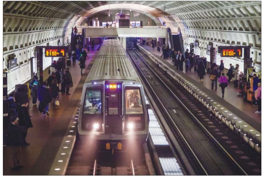
Vấn đề an toàn chưa được chú trọng tại Metro

Cuộc kiểm toán cho thấy, chính các nhân viên của Metro đang phải làm việc trong môi trường, điều kiện không an toàn, do đó, các tiêu chí về an toàn đối với hành khách cũng bị xem nhẹ. Vấn đề sức khỏe của nhân viên không được quan tâm, đa số nhân viên phải làm việc quá sức. Metro từng quy định rằng, các cán bộ điều khiển tàu không được làm việc quá 6 ngày liên tục không nghỉ,