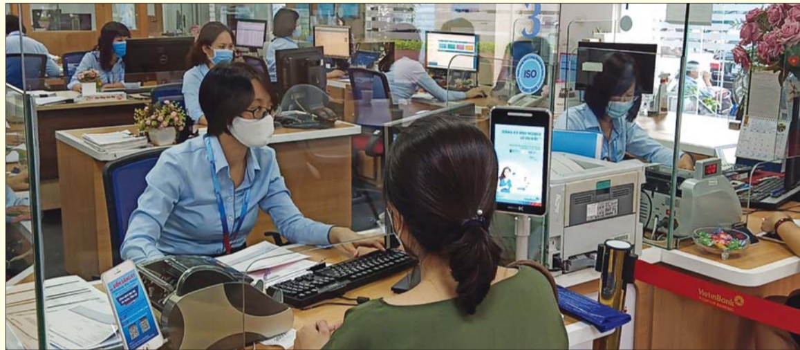
Các ngân hàng luôn đóng vai trò quan trọng trong việc thúc đẩy TCTD