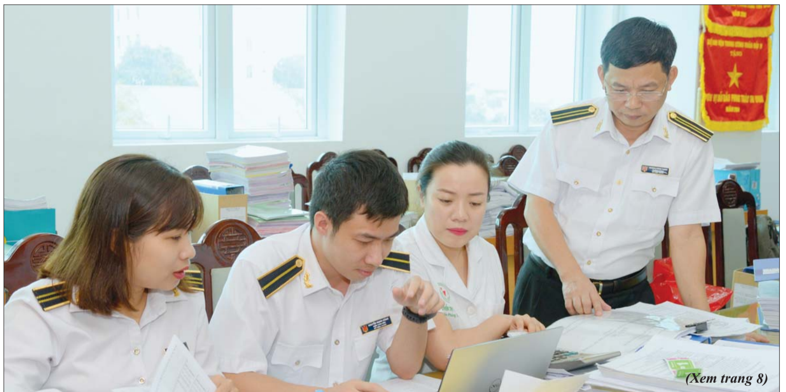
(Xem trang 8)