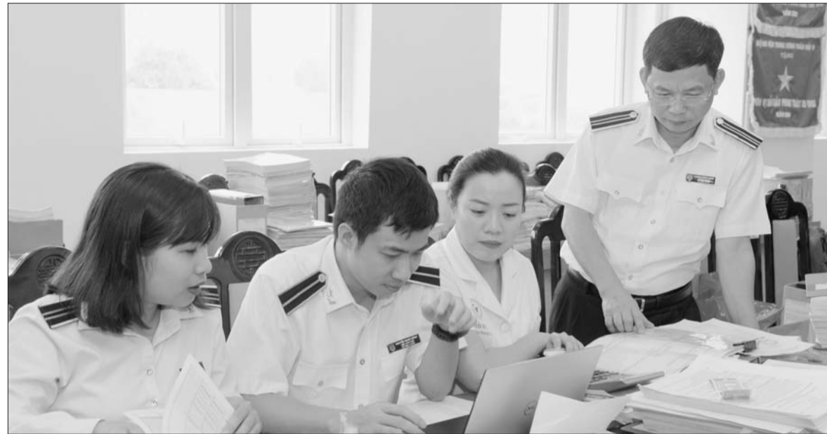
KTNN chỉ ra nhiều bất cập, hạn chế trong lập dự toán thu, chi NSNN