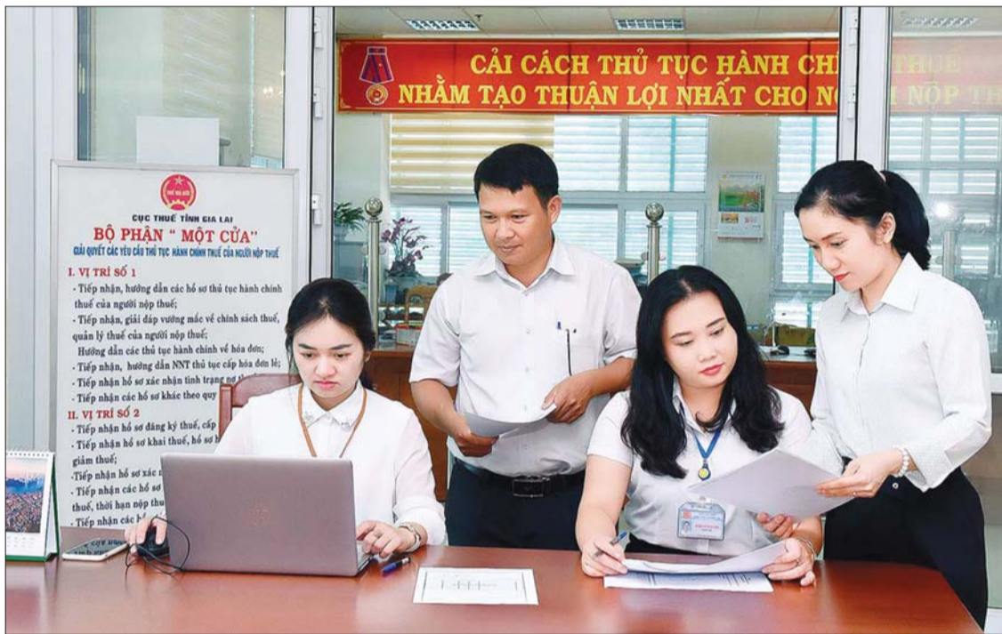
Tăng cường giám sát hồ sơ khai thuế nhằm đôn đốc các tổ chức, cá nhân thực hiện kịp thời nghĩa vụ thuế đối với NSNN Ảnh tư liệu

Với việc triển khai quyết liệt các giải pháp quản lý thu, đẩy mạnh cải cách thủ tục hành chính, tạo điều kiện thuận lợi cho người nộp thuế, quản lý chặt chẽ công tác đăng ký, kê khai, nộp thuế, tăng cường thanh tra, kiểm tra và quản lý chặt chẽ nợ đọng thuế, ngành thuế đã đạt được nhiều tiến bộ cả về quy mô, tốc độ và cơ cấu thu trong giai đoạn 2016-2019. Cụ thể, quy mô thu ngân sách năm 2019 gấp 1,55 lần so với năm 2015, trong đó, thu NSNN do cơ quan thuế quản lý gấp 1,56 lần. Tốc độ tăng trưởng thu NSNN bình quân giai đoạn đạt 11,6%/năm, trong đó, thu NSNN do cơ quan thuế quản lý tăng 11,8%/năm. Tỷ lệ huy động NSNN trên thu nhập bình quân đầu người (GDP) bình quân giai đoạn đạt 25,5% GDP. Trong đó, tỷ lệ huy động từ thuế, phí, lệ phí đạt 21,2% GDP, cao hơn mục tiêu đề ra theo Nghị quyết số 25/2016/QH14 của Quốc hội về kế hoạch tài chính 5 năm quốc gia giai đoạn 2016-2020 (tỷ lệ huy động vào NSNN không thấp hơn 23,5% GDP, trong đó, tỷ lệ huy động từ thuế, phí, lệ phí khoảng 21% GDP). Trong giai đoạn này, cơ cấu thu NSNN tiếp tục chuyển biến theo hướng bền vững hơn so với giai đoạn 2011-2015, tỷ trọng thu nội địa chiếm khoảng 80,9% tổng thu NSNN, thu ngân sách giảm dần sự phụ thuộc vào nguồn thu từ dầu thô và hoạt động xuất nhập khẩu (tỷ trọng thu dầu thô trong tổng thu NSNN giảm từ 12,9% của giai đoạn 2011-2015