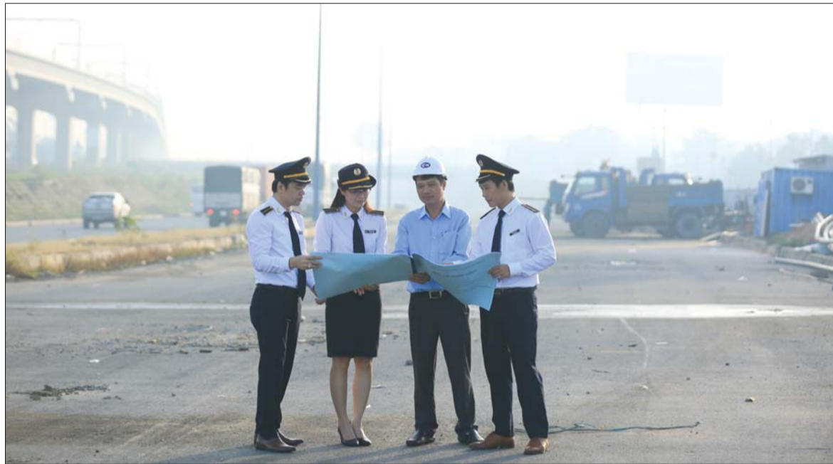
Các kiểm toán viên KTNN khu vực IV tác nghiệp tại hiện trường

Sau 25 năm hình thành và phát triển, KTNN khu vực IV đã đạt được nhiều kết quả trong công tác kiểm toán. Những thành tích xuất sắc của đơn vị đã góp phần quan trọng vào sự phát triển, lớn mạnh của Ngành.