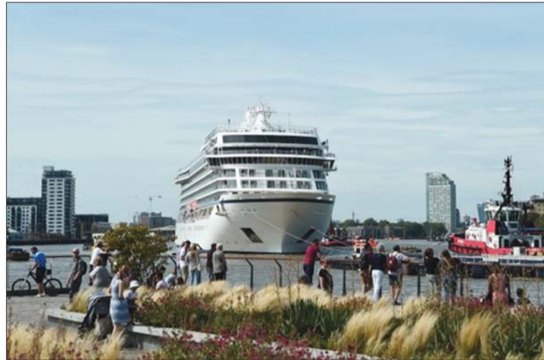
Du thuyền hạng sang “xếp xó” do tác động của dịch Covid-19

Cơ quan Hàng hải Na Uy vừa công bố kết quả kiểm toán đối với Công ty Hurtigruten và các sự kiện xung quanh sự cố Covid-19 xảy ra vào cuối tháng 7/2020 liên quan đến một trong những du thuyền du lịch nổi tiếng của Công ty này là MS Roald Amundsen.