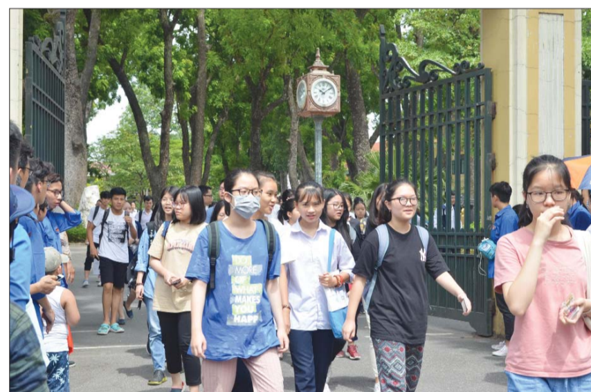
Cần có những quy định mới cụ thể, chặt chẽ hơn để trường học thực sự là một nơi an toàn

Vụ sập cổng trường làm 6 học sinh thương vong ở Lào Cai khiến không ít người bày tỏ lo ngại về vấn đề chất lượng xây dựng trường hiện nay. Sau khi vụ tai nạn này xảy ra, Bộ GD&ĐT mới có công văn đề nghị