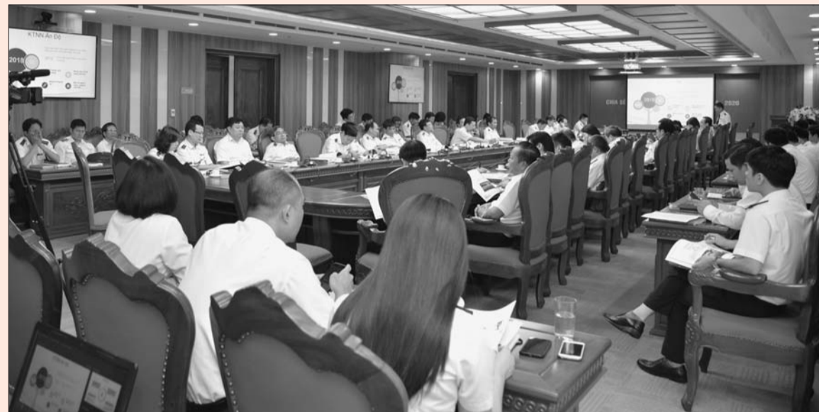
Quang cảnh buổi Tọa đàm

"Phổ biến kinh nghiệm quốc tế từ các đoàn học tập, hội nghị, hội thảo từ nước ngoài của KTNN năm 2019-2020" là tên gọi của Tọa đàm diễn ra sáng 11/9 tại trụ sở KTNN. Tại buổi Tọa đàm, các diễn giả đã cùng nhau chia sẻ những thông lệ tốt và kinh nghiệm kiểm toán quốc tế trong các lĩnh vực: dầu khí, công nghệ thông tin (CNTT), môi trường, việc thực hiện các Mục tiêu phát triển bền vững (SDGs) tại một số cơ quan kiểm toán tối cao (SAI) trên thế giới.