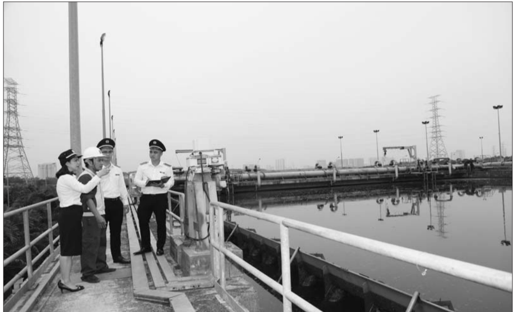
Những năm gần đây, KTNN đã từng bước tổ chức thực hiện KTMT

Bởi vậy, theo KTNN, việc đưa hoạt động kiểm toán vào Luật BVMT (sửa đổi) sẽ tạo điều kiện thuận lợi cho KTNN thực hiện tốt hơn vai trò đã được hiến định.