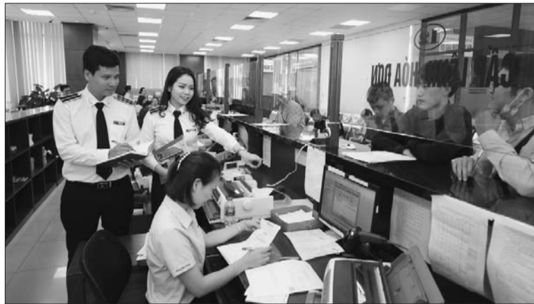
Kiểm toán viên nhà nước (đứng mặc đồng phục) làm việc tại đơn vị được kiểm toán

Dịch Covid-19 ảnh hưởng lớn đến hoạt động sản xuất kinh doanh, công tác kế toán và việc lập báo cáo tài chính (BCTC) của đơn vị được kiểm toán. Điều này đòi hỏi kiểm toán viên (KTV) phải xem xét mức độ tác động của đại dịch đến hoạt động của DN được kiểm toán để xây dựng kế hoạch kiểm toán cho phù hợp.