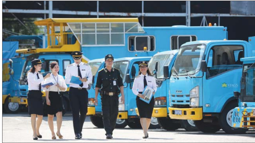
Cần phát triển hệ thống tổ chức bộ máy KTNN trong giai đoạn tới theo hướng chuyên nghiệp, chất lượng, hiệu quả Ảnh tư liệu

Để đảm bảo thực hiện tốt nhất vai trò, trách nhiệm của KTNN, phát triển KTNN là công cụ trọng yếu, hiệu quả của Đảng và Nhà nước trong kiểm tra, kiểm soát việc quản lý và sử dụng tài chính công, tài sản công, Dự thảo Chiến lược phát triển KTNN đến năm 2030 (giai đoạn 2021-2030) xác định tiếp tục hoàn thiện tổ chức bộ máy của Ngành theo hướng chuyên nghiệp, hiệu quả đi đôi với phát triển đội ngũ công chức, kiểm toán viên (KTV) đủ về số lượng, đáp ứng yêu cầu chất lượng.