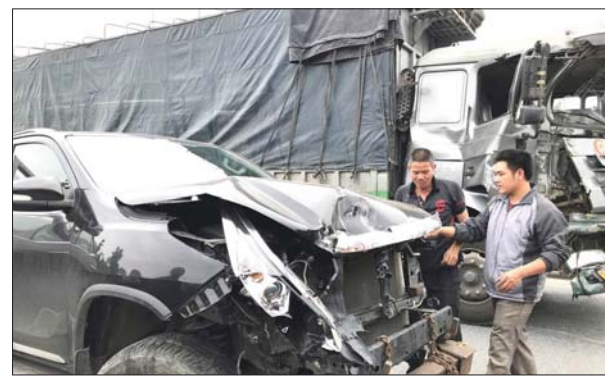
Không ít vụ TNGT có nguyên nhân do bất cập về hạ tầng. Ảnh minh họa

trong thời gian thấp điểm, xe cộ lưu thông ít (giữa đêm khuya và rạng sáng), sử dụng rượu bia, ma túy... Ngoài ra, cũng không ít vụ có nguyên nhân do công trình giao thông đường bộ không đảm bảo an toàn như: đường thiếu dải phân cách; việc duy tu, sửa chữa đường, sơn kẻ vạch sai với quy định, không có đèn chiếu sáng. Đơn cử như vụ TNGT xảy ra tại Quảng Ninh ngày 10/7 khi chiếc ô tô lao xuống biển khiến 4 người tử vong. Sau khi kiểm tra, Ban An toàn giao thông (ATGT) tỉnh Quảng Ninh thừa nhận, ngoài nguyên nhân thuộc về người điều khiển phương tiện, thì cũng có một phần nguyên nhân do hạ tầng. Bởi đây là đoạn đường vừa thi công, vừa khai thác, nhưng đơn vị thi công tuyến đường không có biển cảnh báo nguy hiểm, không tổ chức cảnh giới, tuyến đường chưa được lắp đặt hệ thống chiếu sáng, không có dây phản quang để hướng dẫn người tham gia giao thông.