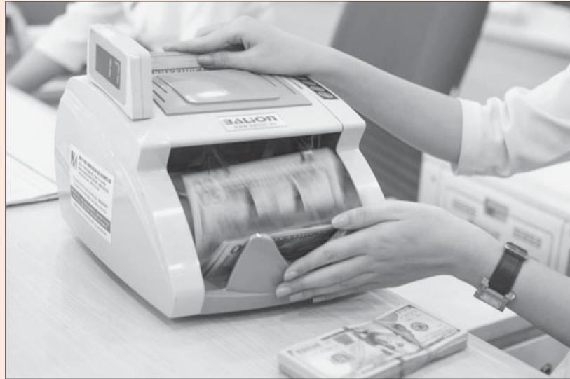
Thủ tướng Chính phủ đã có chủ trương xem xét tăng tỷ lệ nợ công thêm 2 - 3% GDP Ảnh minh họa

Trước ảnh hưởng của Covid-19, Thủ tướng Chính phủ đã có chủ trương xem xét tăng tỷ lệ nợ công thêm 2 - 3% GDP để có thêm nguồn lực hỗ trợ nền kinh tế. Khi đó, tỷ lệ nợ công vẫn trong giới hạn được Quốc hội cho phép. Tuy nhiên, việc tính toán, đề xuất trần nợ công sẽ được cân nhắc kỹ để đảm bảo an toàn, bền vững cho nền tài chính quốc gia.