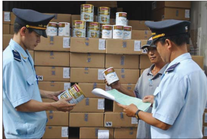
Cải cách mô hình kiểm tra chất lượng hàng hóa nhập khẩu sẽ góp phần cắt giảm chi phí, thời gian và tạo thuận lợi cho DN Ảnh minh họa

Đề án Cải cách mô hình kiểm tra chất lượng, kiểm tra an toàn thực phẩm đối với hàng hóa nhập khẩu (Đề án) đang được Tổng cục Hải quan (Bộ Tài chính) hoàn thiện. Cộng đồng DN kỳ vọng, việc ban hành và triển khai Đề án này trong tương lai sẽ giúp giảm chi phí, thời gian và tạo thuận lợi cho DN.