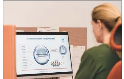
IIA khuyến nghị giúp củng cố hoạt động của các ủy ban kiểm toán Anh: Accountingtoday

Báo cáo của IIA chỉ ra rằng, giám sát chặt chẽ công tác quản lý rủi ro là một nhiệm vụ cơ bản và đầy thách thức đối với các ủy ban kiểm toán. Ủy ban cần dựa vào kiểm toán nội bộ để hoàn thành nhiệm vụ đó. Kiểm toán nội bộ cần tư vấn một cách độc lập, khách quan giúp hỗ trợ công tác quản lý rủi ro hiện tại, đồng thời cung cấp những phân tích, dự đoán về khả năng quản lý rủi ro trong tương lai.