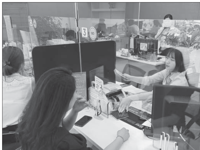
Chuyển đổi số sẽ mang lại lợi ích lớn cho các nhà băng

Thúc đẩy phát triển dịch vụ ngân hàng số là một trong những nhiệm vụ 6 tháng cuối năm 2020 mà Ngân hàng Nhà nước (NHNN) đặt ra đối với các tổ chức tín dụng, chi nhánh ngân hàng nước ngoài. Đây cũng là hoạt động được các nhà băng đẩy mạnh triển khai trong thời gian qua.