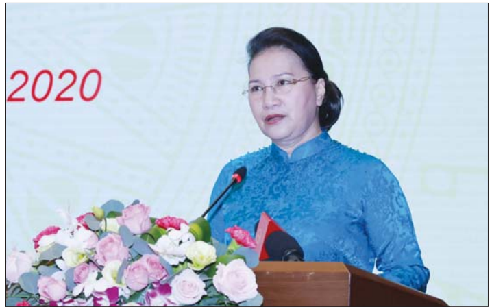
Chủ tịch Quốc hội Nguyễn Thị Kim Ngân phát biểu tại buổi Lễ