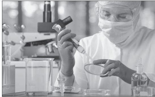
Việc số hóa đã tạo thuận lợi để tăng cường kiểm soát thuốc kê đơn

Với việc đẩy mạnh ứng dụng công nghệ thông tin trong thực hiện dịch vụ công (DVC), quản lý thuốc, quản lý cơ sở cung ứng thuốc và quản lý chứng chỉ hành nghề, ngành dược đã tạo điều kiện thuận lợi tối đa cho cá nhân, DN trong thực hiện thủ tục hành chính. Qua đó góp phần tăng tính công khai, minh bạch, đồng thời đem lại hiệu quả kinh tế do cắt giảm được nhiều chi phí liên quan.