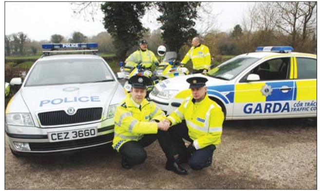
Lực lượng cảnh sát An Garda Síochána

Đây không phải là lần đầu những lỗ hổng trong hoạt động quản lý của An Garda Síochána bị phơi bày. Trước đó, An