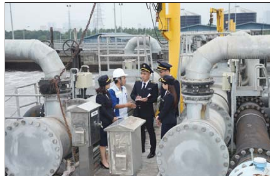
Kiểm toán viên nhà nước kiểm tra công trình xử lý nước thải

Trong những năm qua, KTNN đã thể hiện rõ lập trường nhất quán đối với vấn đề bảo vệ môi trường và nỗ lực không ngừng để thực hiện. Đặc biệt, với chức năng được hiến định là cơ quan hoạt động độc lập, chỉ tuân theo pháp luật, KTNN sẽ thực hiện chức năng kiểm tra, đánh giá việc thực hiện của Chính phủ và các Bộ, ngành liên quan đối với Kế hoạch hành động quốc gia thực hiện Chương trình Nghị sự 2030 vì sự phát triển bền vững (PTBV) đã được Chính phủ ban hành.