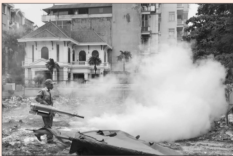
Cán bộ Trung tâm Y tế quận Cầu Giấy phun hóa chất diệt muỗi

Bộ Y tế cho biết, ngày 20/5, theo hệ thống giám sát bệnh truyền nhiễm của Việt Nam đã ghi nhận 1 trường hợp mắc bệnh do virus Zika