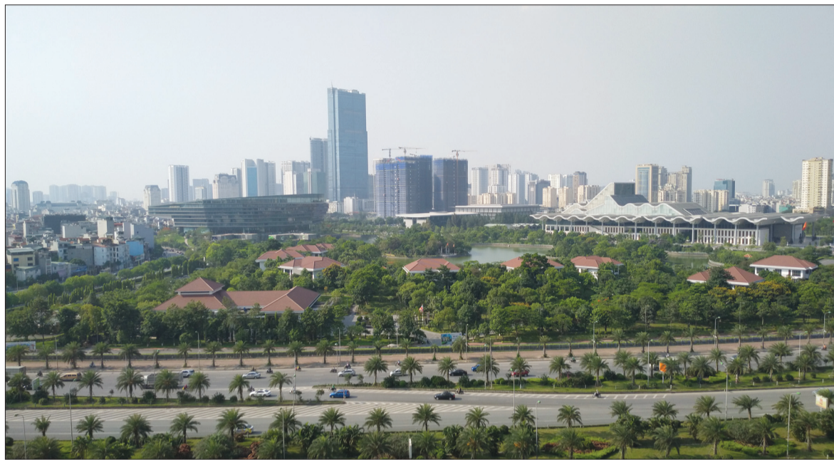
Các vùng KTTĐ cần có cơ chế đặc thù để thực sự trở thành đầu tàu lôi kéo sự phát triển các vùng kinh tế khác trong cả nước Ảnh: V.HOÀNG

Các vùng kinh tế trọng điểm (KTTĐ) vốn được coi là cực tăng trưởng quan trọng của đất nước. Bởi vậy, giới chuyên gia khuyến nghị, để thực sự trở thành đầu tàu lôi kéo sự phát triển các vùng kinh tế khác trong cả nước, các vùng này cần phải có cơ chế đặc thù, đó sẽ là kim chỉ nam nhằm hiện thực hóa các tầm nhìn.