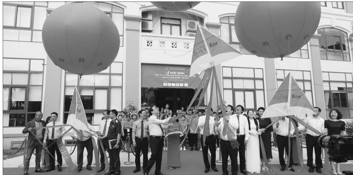
Lễ phát động Cuộc thi Startup Kite năm 2020

Ý tưởng khởi nghiệp của các học sinh, sinh viên giáo dục nghề nghiệp (GDNN) hôm nay là nhỏ nhưng ngày mai có thể trở thành đốm lửa sáng dưới sự đào tạo của nhà trường và sự đồng hành, dẫn dắt của các DN, doanh nhân thành đạt. Đó là thông điệp của Bộ trưởng Bộ Lao động, Thương binh và Xã hội (LĐ,TB&XH) Đào Ngọc Dung tại Lễ phát động Cuộc thi “Ý tưởng khởi nghiệp học sinh, sinh viên GDNN năm 2020” - Startup Kite.