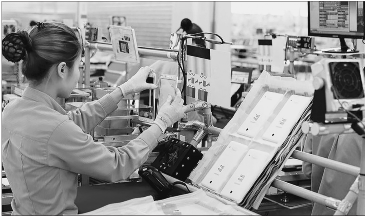
Không ít DN FDI đã đưa máy móc, thiết bị, công nghệ lạc hậu vào Việt Nam