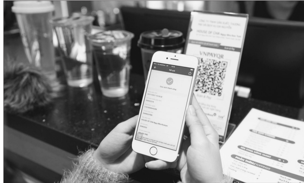
Hoạt động TTĐTLNH đang phát triển mạnh mẽ

Sáu tháng đầu năm 2020, trong khi tín dụng giảm sâu, nợ xấu tiềm ẩn có xu hướng tăng... thì hoạt động thanh toán, đặc biệt là thanh toán điện tử liên ngân hàng (TTĐTLNH) lại có bước phát triển mạnh mẽ. Đây là động lực để nhiều quyết sách của Chính phủ, Ngân hàng Nhà nước (NHNN) trong lĩnh vực này sớm được ban hành và đi vào cuộc sống, góp phần thúc đẩy thanh toán điện tử, hướng tới xây dựng nền kinh tế số.