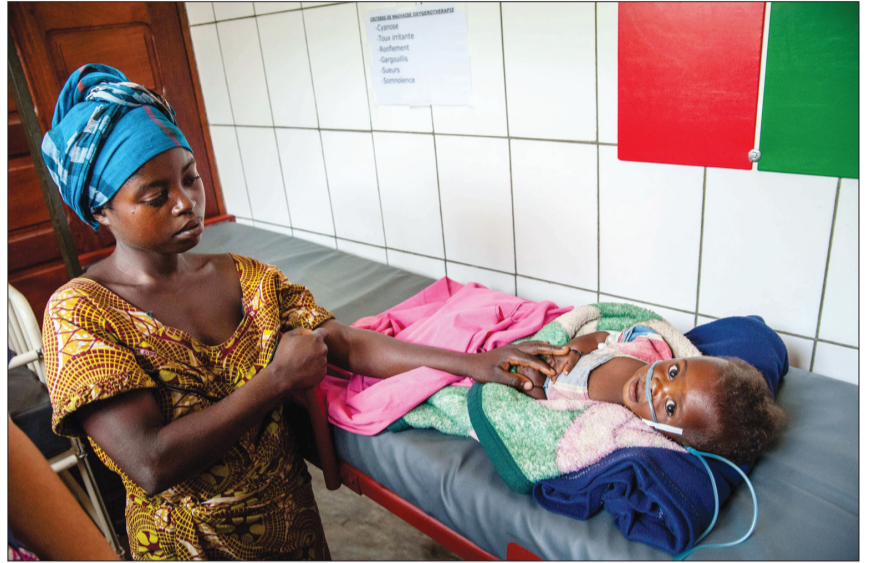
Ngân sách phòng, chống bệnh sốt rét chưa được sử dụng hiệu quả tại Congo Anh: dobrofabryka.pl

Thứ hai, OIG nhấn mạnh, công tác kiểm soát nội bộ và mua sắm công rất yếu kém, công tác quản lý tài chính cũng để xảy ra nhiều sai sót dẫn đến việc sử dụng ngân sách tài trợ không hiệu quả. OIG yêu cầu cần thu hồi những khoản chi không có tài liệu, chứng từ thanh toán đi kèm dù chúng được chi tiêu vào bất kỳ lý do nào.