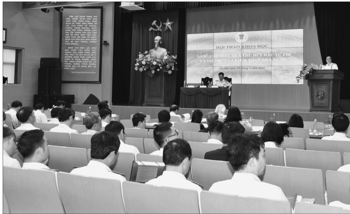
Quang cảnh Hội thảo

Việc mở cửa thu hút vốn đầu tư trực tiếp nước ngoài (FDI) là một chủ trương lớn, đúng đắn của Đảng và Nhà nước, góp phần thực hiện nhiều mục tiêu phát triển kinh tế - xã hội quan trọng của đất nước trong suốt 30 năm qua. Tuy nhiên, so với những chính sách ưu đãi được hưởng, đóng góp của khu vực kinh tế này đối với nền kinh tế vẫn chưa tương xứng. Đây là vấn đề được nhiều đại biểu thảo luận, làm rõ tại Hội thảo “Nâng cao hiệu quả thu hút đầu tư FDI và vai trò của Kiểm toán Nhà nước” diễn ra ngày 09/6, tại Hà Nội.