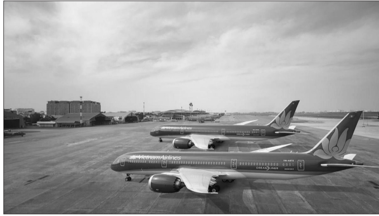
DN hàng không thiệt hại nặng nề giữa vòng xoáy Covid-19

Hàng không Việt Nam đang có sự phục hồi mạnh mẽ. Nhiều ý kiến cho rằng, các hãng hàng không cần tận dụng lợi thế của một quốc gia sớm khống chế được dịch bệnh để khai thác tốt thị trường nội địa, tiếp đến là thị trường quốc tế khi thế giới đẩy lùi được dịch Covid-19.