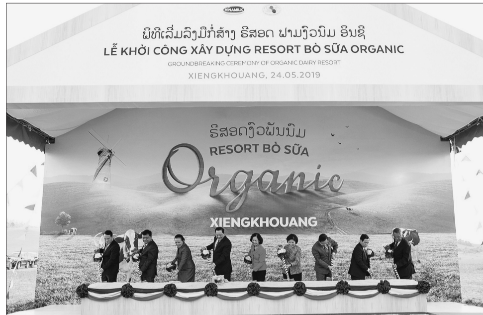
Lễ khởi công Dự án Tổ hợp trang trại bò sữa của Vinamilk tại cao nguyên Xiêng Khoảng, Lào

Công ty Cổ phần Sữa Việt Nam (Vinamilk) lần thứ 8 liên tiếp được vinh danh trong Top "50 công ty niêm yết tốt nhất" do Tạp chí Forbes Việt Nam bình chọn. Đây là kết quả của những chiến lược kinh doanh hiệu quả trong năm 2019 và những tháng đầu năm 2020, giữa bối cảnh nền kinh tế trong nước và thế giới đang chịu các tác động của dịch Covid-19.