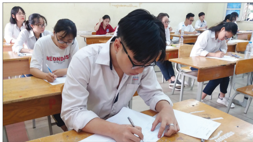
Kỳ thi Tốt nghiệp THPT năm 2020 sẽ có sự hiện diện thanh tra, kiểm tra của 3 cấp (Bộ, tỉnh, sở) tham gia

Bộ Giáo dục và Đào tạo (GD&ĐT) cho biết, năm 2020 sẽ không tổ chức Kỳ thi Trung học phổ thông (THPT) quốc gia như những năm trước mà chỉ tổ chức Kỳ thi Tốt nghiệp THPT. Ngoài mục đích chính là xét tốt nghiệp THPT thì nhiều trường đại học vẫn sử dụng kết quả của Kỳ thi này để xét tuyển. Do đó, để Kỳ thi diễn ra an toàn, minh bạch, đúng quy chế, công tác thanh tra, kiểm tra được Bộ hết sức coi trọng.