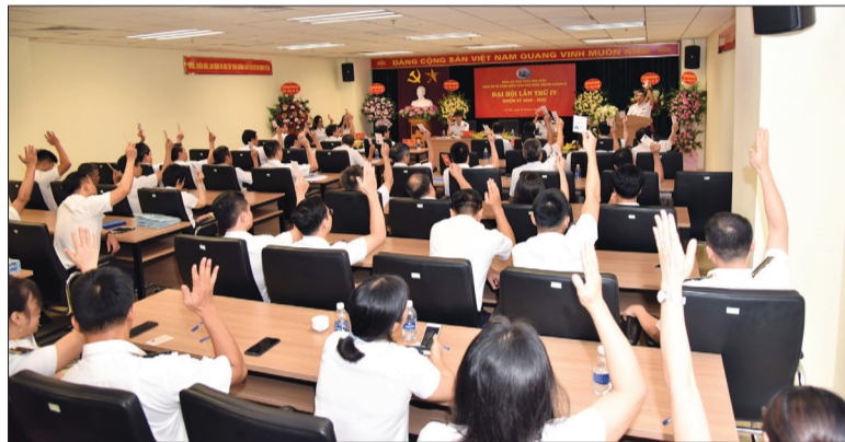
Qua đánh giá tại đại hội các đảng bộ, chi bộ vừa qua, chất lượng sinh hoạt chi bộ không ngừng được nâng lên

Nhiệm kỳ qua, các tổ chức cơ sở đảng trong Đảng bộ KTNN đã đặc biệt quan tâm tới việc nâng cao chất lượng sinh hoạt chi bộ. Thông qua nhiều hình thức tổ chức sáng tạo, thiết thực, hoạt động này đã mang lại những hiệu quả tích cực, góp phần tăng cường năng lực lãnh đạo, sức chiến đấu của tổ chức cơ sở đảng trong tình hình mới.