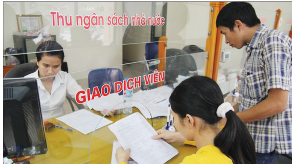
Theo Luật NSNN, trường hợp dự kiến số thu không đạt dự toán thì phải xem xét, điều chỉnh giảm tương ứng một số khoản chi để đảm bảo cân đối NSNN

Năm tháng qua, một số mặt hàng có số thu ngân sách lớn giảm mạnh như: xăng dầu các loại, ô tô nguyên chiếc, thu từ khu vực DNNN, thu từ khu vực kinh tế ngoài quốc doanh; các loại phí, lệ phí... Bộ trưởng Bộ Tài chính Đinh Tiến Dũng cho biết, theo Luật NSNN, trường hợp dự kiến số thu không đạt dự toán thì phải xem xét, điều chỉnh giảm tương ứng một số khoản chi để đảm bảo cân đối NSNN.