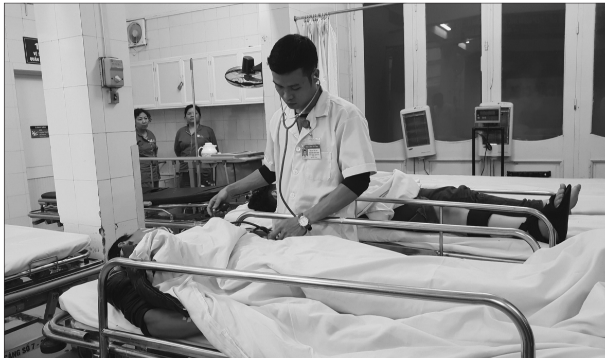
KTNN đưa ra nhiều kiến nghị trong tự chủ tại các bệnh viện

Tổng hợp kết quả 2 cuộc kiểm toán chuyên đề việc thực hiện cơ chế tự chủ tại các trường đại học, bệnh viện công lập giai đoạn 2016-2018 cho thấy, KTNN đã phát hiện nhiều bất cập trong việc thực hiện cơ chế tự chủ về tổ chức bộ máy, thực hiện nhiệm vụ, tự chủ tài chính... Từ đó, KTNN đã kiến nghị sửa đổi nhiều văn bản không còn phù hợp, cũng như đưa ra những ý kiến tư vấn hoàn thiện công tác quản lý nhằm tháo gỡ những khó khăn, vướng mắc trong quá trình thực hiện cơ chế tự chủ.