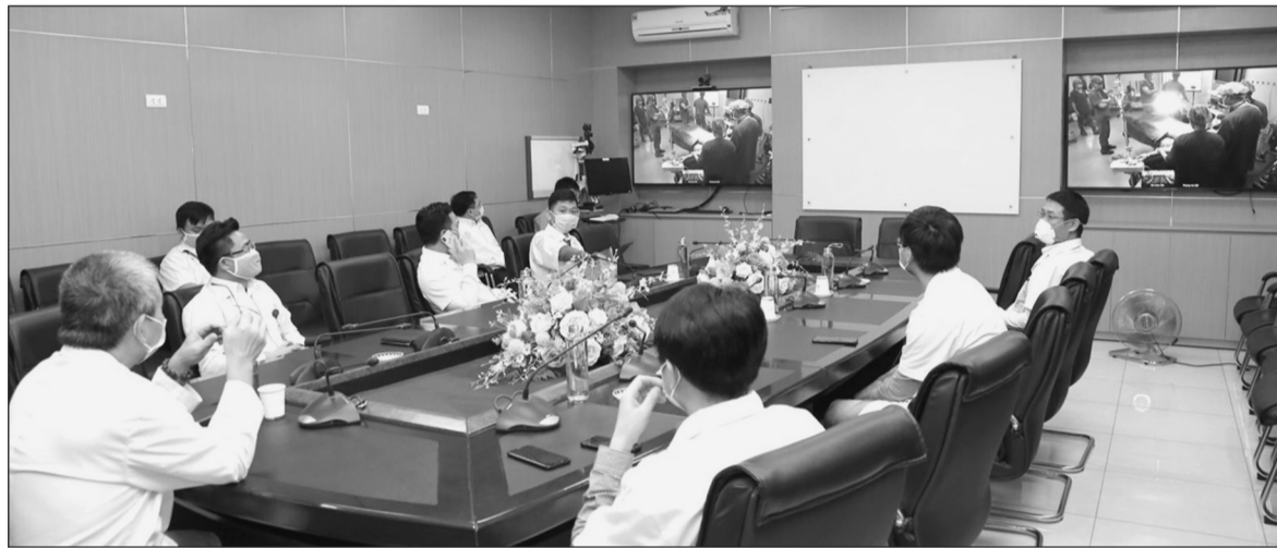
Các bác sĩ Bệnh viện Hữu nghị Việt Đức hội chẩn từ xa điều trị cho bệnh nhân tại bệnh viện tuyến dưới

Bộ Y tế đang xây dựng Dự thảo Đề án khám, chữa bệnh từ xa giai đoạn 2020-2025. Đây được kỳ vọng là giải pháp hiệu quả với nhiều lợi ích thiết thực, góp phần nâng cao chất lượng khám, chữa bệnh (KCB) tuyến dưới, củng cố niềm tin của người dân với bệnh viện, giảm tỷ lệ chuyển tuyến lên bệnh viện tuyến trên, giảm thời gian, kinh phí đi lại cho người bệnh.