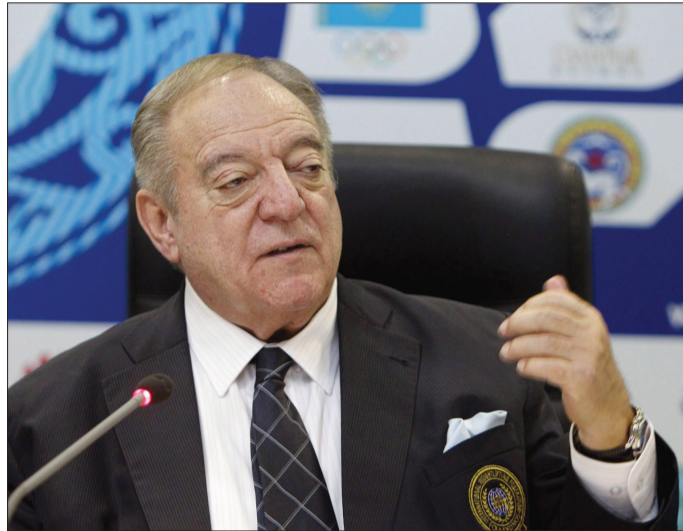
Cựu Chủ tịch IWF Tamas Ajan bị cáo buộc tham nhũng

Một cuộc kiểm toán độc lập tại Liên đoàn Cử tạ Thế giới (IWF) gần đây đã phát hiện tham nhũng trên diện rộng và hàng chục xét nghiệm doping bị che giấu. Các kiểm toán viên cũng cáo buộc cách lãnh đạo độc đoán, độc tài của cựu Chủ tịch IWF Tamas Ajan đã khiến IWF bị rối loạn, dẫn đến hoạt động không hiệu quả.