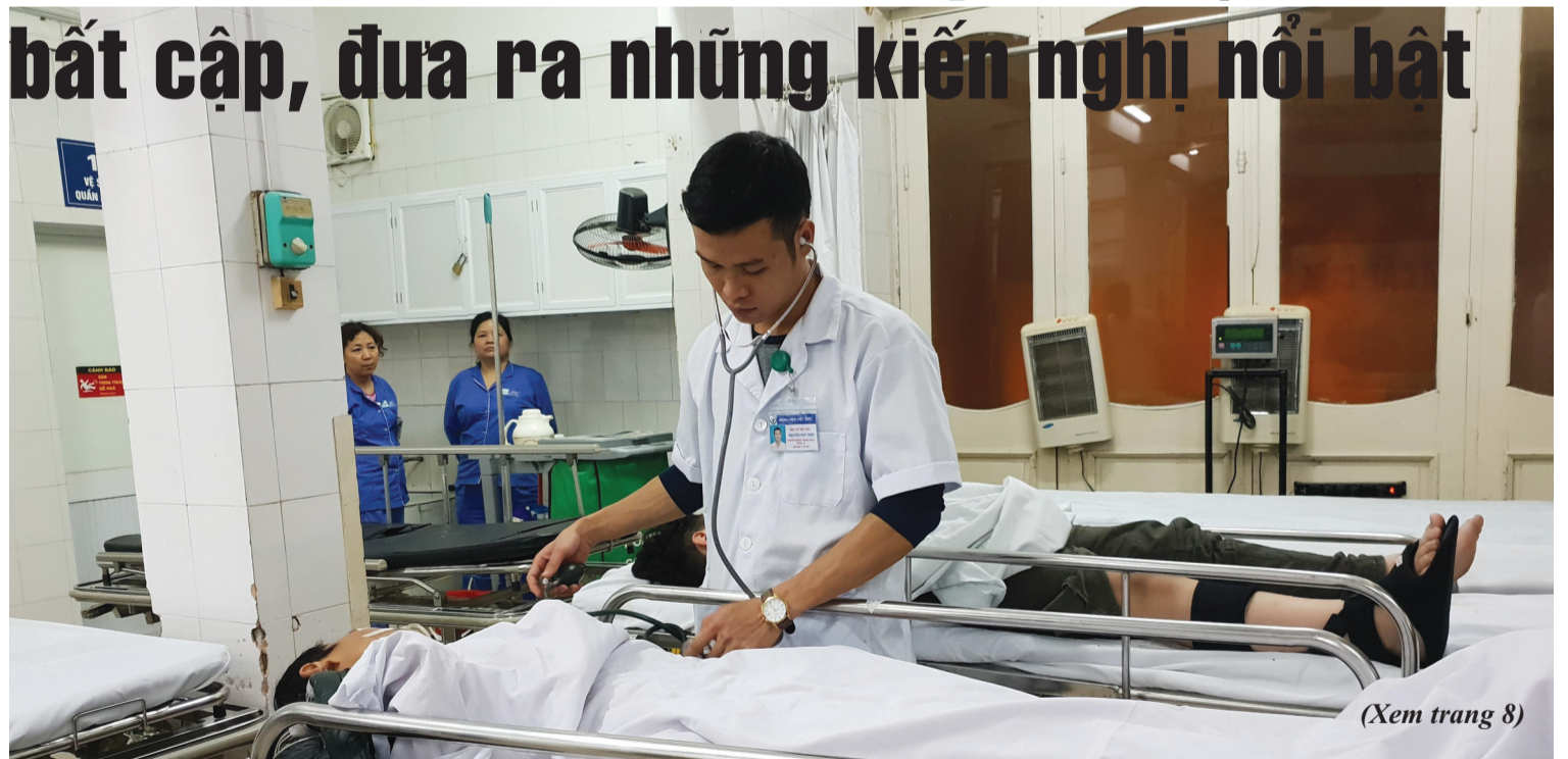
(Xem trang 8)