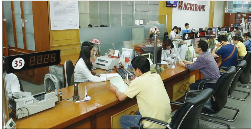
Việc tăng vốn điều lệ cho Agribank sẽ góp phần tăng năng lực tài chính, năng lực cạnh tranh, tăng cường vai trò và đóng góp của Agribank cho nền kinh tế Ảnh minh họa

Chính phủ vừa có Tờ trình đề nghị Quốc hội xem xét việc bổ sung vốn điều lệ cho Ngân hàng Nông nghiệp và Phát triển nông thôn Việt Nam (Agribank), với mức vốn đề xuất bổ sung năm 2020 tối đa không quá 3.500 tỷ đồng từ nguồn tăng thu, tiết kiệm chi ngân sách năm 2019.