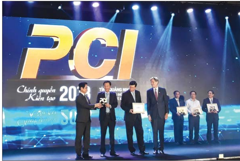
Tôn vinh 5 tỉnh, thành phố dẫn đầu PCI 2018

Báo cáo Chỉ số năng lực cạnh tranh cấp tỉnh (PCI 2018) vừa được Phòng Thương mại và Công nghiệp Việt Nam (VCCI) phối hợp với Cơ quan Viện trợ Phát triển Quốc tế Hoa Kỳ (USAID) công bố thể hiện rõ một “bức tranh” với nhiều khởi sắc, thông qua những chỉ số được cải thiện đáng kể so với những năm trước. Minh chứng là điểm số PCI của tỉnh trung vị đã đạt 61,76 điểm, cao nhất trong 11 năm qua, kể từ khi bắt đầu đánh giá xếp hạng PCI.