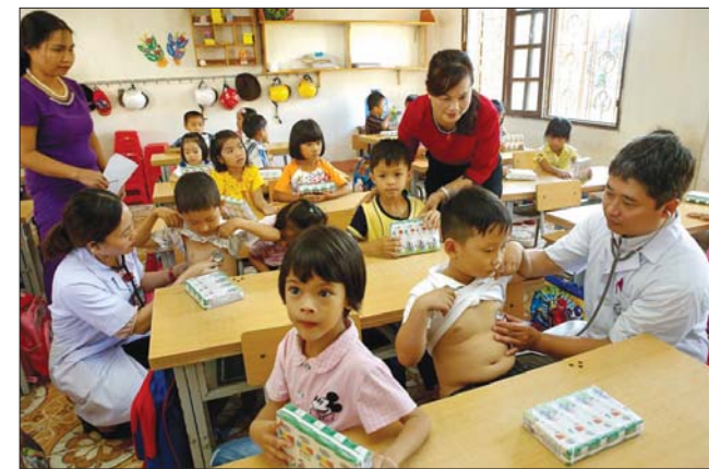
HSSV là nhóm được NSNN hỗ trợ mức đóng BHYT

Bên cạnh đó, quyền lợi khám, chữa bệnh của nhân dân nói chung và HSSV nói riêng khi tham gia BHYT cũng được mở rộng. Đặc biệt từ ngày 01/01/2016, quy định thông tuyến huyện đã tạo nhiều thuận lợi cho việc khám, chữa bệnh đối với người tham gia BHYT, trong đó có HSSV. Thống kê của Bảo hiểm xã hội (BHXH) Việt Nam cho thấy, nhiều học sinh không may bị ốm đau, bệnh tật, tai nạn... đã được Quỹ BHYT chi trả chi phí điều trị lên đến hàng trăm triệu đồng như các trường hợp điều trị ung thư, chạy thận nhân tạo; phẫu thuật tim mạch; không ít trường hợp được thanh toán tới trên dưới 1 tỷ đồng mỗi năm.