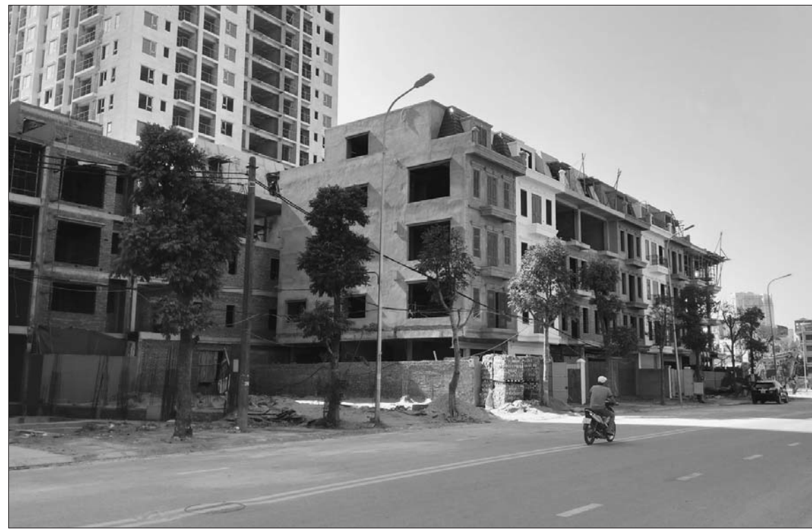
Theo nhận định của các chuyên gia, thị trường BĐS năm 2019 tiếp đà đi lên với sự thay đổi về chất

Thị trường bất động sản (BDS) Việt Nam năm 2019 được đánh giá là sẽ có nhiều thách thức nhưng cũng tạo cơ hội bứt phá cho các DN biết tận dụng, đón đầu được xu thế của thị trường.