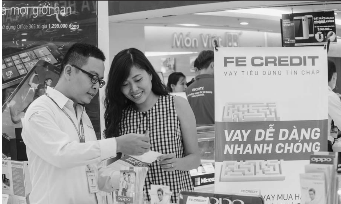
Thị trường tài chính tiêu dùng đang phát triển mạnh mẽ trong thời gian gần đây Ảnh minh họa

Thị trường tài chính tiêu dùng Việt Nam đang có cơ hội “vàng” để phát triển với các điều kiện lý tưởng, như: kinh tế phát triển ổn định, 52% dân số trong độ tuổi lao động với thu nhập tăng dần, đặc biệt là sự thay đổi rõ rệt trong hoạt động mua sắm và tiếp nhận công nghệ.