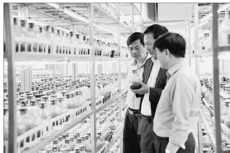
Các tổ chức nghiên cứu đang trở thành cầu nối đưa nghiên cứu ứng dụng đi vào cuộc sống

Thời gian qua, các DN, trung tâm khoa học và công nghệ (KH&CN) thuộc trường đại học (ĐH) đã và đang trở thành cầu nối quan trọng góp phần đưa các nghiên cứu ứng dụng vào thực tế cuộc sống. Tuy nhiên, bên cạnh những kết quả đạt được, hoạt động của các tổ chức KH&CN công lập vẫn gặp nhiều rào cản cần sớm được tháo gỡ.