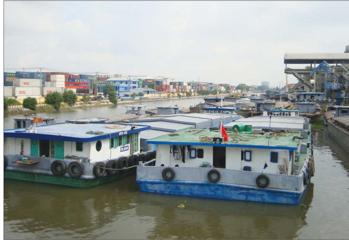
Việc đầu tư phát triển giao thông đường thủy sẽ góp phần giảm chi phí logistics

Theo đánh giá của chuyên gia giao thông, Việt Nam có nhiều thế mạnh về bờ biển, đường thủy nội địa, lẽ ra, đường thủy phải là giao thông chủ lực để vận tải hàng hóa và hành khách. Tuy nhiên, thời gian qua, giao thông vận tải (GTVT) đường bộ phát triển rất mạnh, còn giao thông đường thủy lại giảm dần tỷ trọng. Vì vậy, cần đầu tư, phát triển hơn nữa vận tải đường thủy nội địa, từ đó giảm chi phí logistics.