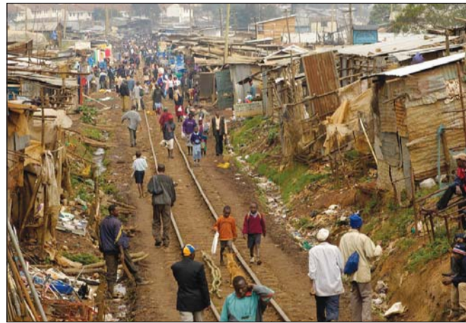
Tình trạng nghèo đói tràn lan tại Kenya là hậu quả của nạn tham nhũng dai dẳng

Báo cáo kiểm toán cũng cho thấy, Bomet là quận đứng đầu danh sách các quận có những khoản chi phí cho mục đích đi công tác, du lịch nước ngoài trái quy định cao nhất, có tới 87,6% ngân sách quận chi cho các chuyên công tác phí nước ngoài không tuân thủ các quy định của pháp luật, nhiều khoản chi mờ ám có dấu hiệu biến thủ ngân sách công.