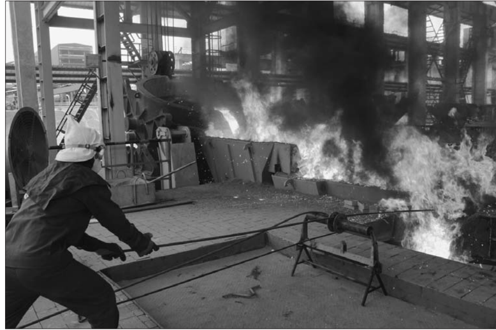
Nhiều DN lớn xin được lùi thời hạn CPH

Theo chỉ đạo của Thủ tướng Chính phủ, năm 2018, cả nước sẽ cổ phần hóa (CPH) 64 DN nhưng chỉ có 23 DN được phê duyệt phương án. Về thoái vốn, năm 2018 chỉ thực hiện thoái vốn tại 57 DN, chưa bằng 1/3 số DN phải thoái vốn theo kế hoạch.