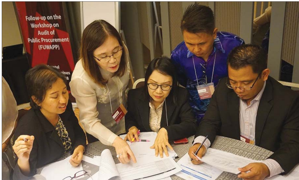
Kiểm toán viên Malaysia thực thi công vụ

Năm 2016, 7 cơ quan kiểm toán tối cao (SAI) thành viên Tổ chức Các cơ quan Kiểm toán tối cao Đông Nam Á (ASEANSAI) gồm: Campuchia, Indonesia, Lào, Malaysia, Philippines, Thái Lan và Việt Nam đã thực hiện Đề án Kiểm toán thu ngân sách nhằm tăng cường năng lực kiểm toán của các SAI về kiểm toán nguồn thu từ thuế xuất nhập khẩu, thuế giá trị gia tăng và thuế thu nhập DN. Việc thực hiện Đề án này đã đạt được một số kết quả nổi bật.