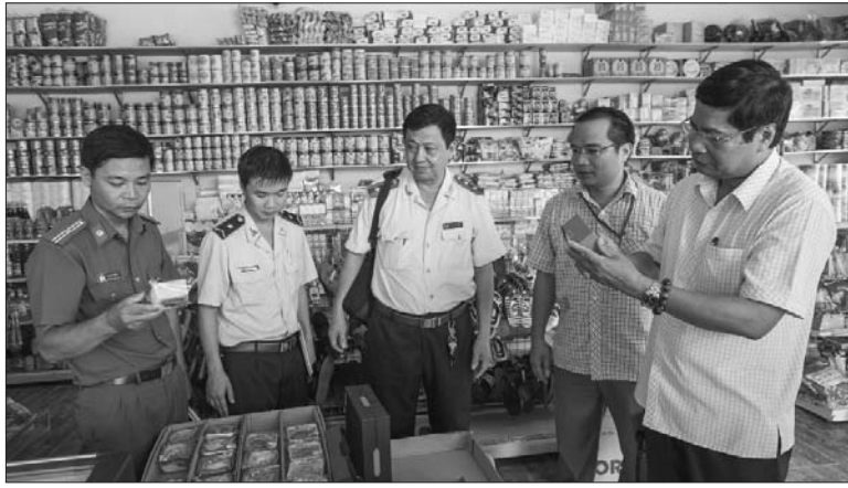
Đoàn thanh tra liên ngành tuyến xã tiến hành kiểm tra về an toàn thực phẩm trên địa bàn theo thẩm quyền Ảnh tư liệu

Cắt giảm điều kiện đầu tư kinh doanh; giảm hơn 95% số thực phẩm nhập khẩu phải kiểm tra chuyên ngành; đồng thời chuyển từ tiền kiểm sang tăng cường hậu kiểm... là những đổi mới căn bản của ngành y tế trong quản lý an toàn thực phẩm nhằm cải cách thủ tục hành chính, tạo điều kiện thông thoáng cho DN kinh doanh thực phẩm, góp phần cải thiện môi trường kinh doanh và năng lực cạnh tranh.