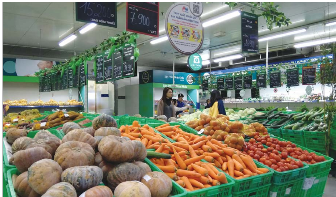
Tỷ lệ xuất khẩu nông sản chính ngạch của Việt Nam vào Trung Quốc vẫn còn khiêm tốn

Dung lượng thị trường và nhu cầu tiêu dùng đối với nhóm hàng nông sản của Trung Quốc rất lớn. Điều này đã tạo ra lực hút và sự quan tâm của những quốc gia có thể mạnh sản xuất nông sản trên thế giới, trong đó có Việt Nam. Tuy nhiên, để tận dụng cơ hội này, DN Việt phải nâng cao chất lượng cũng như thay đổi phương thức xuất khẩu.