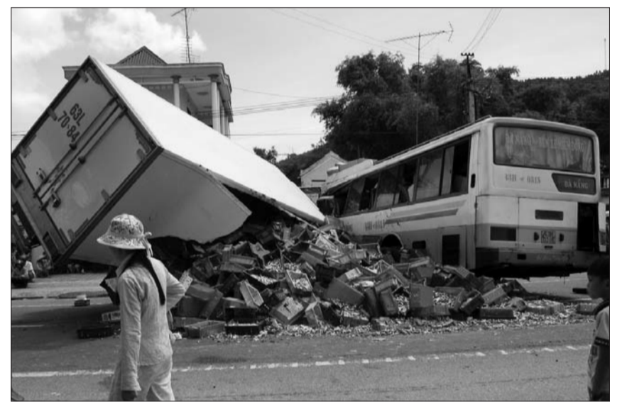
Năm 2018, tình hình TNGT vẫn diễn biến phức tạp

Năm 2019, với chủ đề “An toàn giao thông cho hành khách và