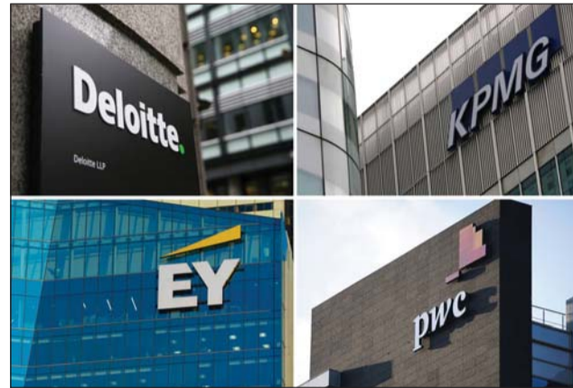
Theo FRC, Big Four cần củng cố uy tín bằng việc nâng cao chất lượng kiểm toán Ảnh minh họa

FRC xác định rằng, mục tiêu không để xảy ra sai sót trong phần lớn các cuộc kiểm toán chưa thể hoàn thành khi một vấn đề cơ bản trong ngành kinh doanh kiểm toán chưa được giải quyết, đó là thiếu tính cạnh tranh. Tuy nhiên, các công