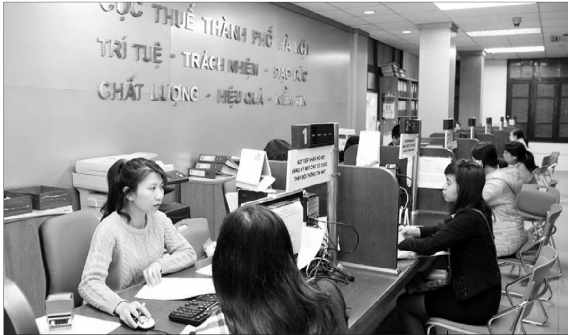
Năm 2018, ngành tài chính hoàn thành toàn diện nhiều chỉ tiêu đề ra

Thủ tướng Chính phủ Nguyễn Xuân Phúc đánh giá: Năm 2018, ngành tài chính đã hoàn thành toàn diện, vượt mức mọi mặt công tác. Tuy nhiên, chính sách tài chính cần nhất quán, hoàn thiện theo hướng tăng tỷ trọng thu nội địa, tăng chi đầu tư, giảm chi thường xuyên, giảm bội chi, hướng đến cân bằng ngân sách trong 5 - 10 năm tới.