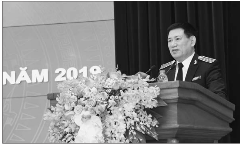
Tổng Kiểm toán Nhà nước phát biểu tại Hội nghị

Đối với lĩnh vực kiểm toán tại các tập đoàn, tổng công ty (TĐ, TCT) nhà nước, lãnh đạo KTNN chuyên ngành VI cho biết, qua kiểm toán năm 2018, đơn vị đã phát hiện nhiều vướng mắc, bất cập của cơ chế, chính sách và đã có những kiến nghị với Chính phủ, các Bộ, ngành, địa phương xem xét, sửa đổi, bổ sung cơ chế, chính sách hoặc xử lý những vướng mắc trong áp dụng văn bản quy