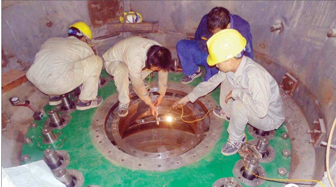
Đào tạo nghề được coi là giải pháp giúp thoát nghèo bền vững, gắn với xây dựng nông thôn mới ở Lào Cai

Tim đến xã Bản Xèo - một xã vùng cao của huyện Bát Xát - ngày cuối năm, chúng tôi được chứng kiến diện mạo mới của một vùng nông thôn miền núi đang thay da, đổi thịt. Hòa chung không khí sản xuất tất bật, người dân nơi đây cũng đang hối hả chuẩn bị cho việc đón nhận Danh hiệu Xã đạt chuẩn nông thôn mới (NTM) theo Chương trình mục tiêu quốc gia Xây dựng NTM (Chương trình).