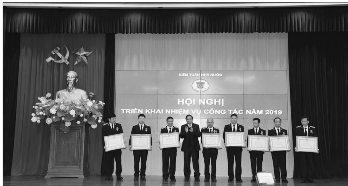
Các cá nhân của KTNN vinh dự đón nhận Huân chương Lao động hạng Nhất, Nhì, Ba

phạm pháp luật. Tuy nhiên, các TĐ, TCT được kiểm toán có quy mô sản xuất kinh doanh lớn; khối lượng hoạt động kinh tế phát sinh đa dạng, phong phú, trên nhiều lĩnh vực, địa bàn; bộ máy quản lý tại DN nhiều cấp, có mối quan hệ đa chiều. Vì vậy, KTNN chuyên ngành VI kiến nghị cần phải nâng cao chất lượng nguồn nhân lực kiểm toán để đáp ứng yêu cầu thực tiễn.