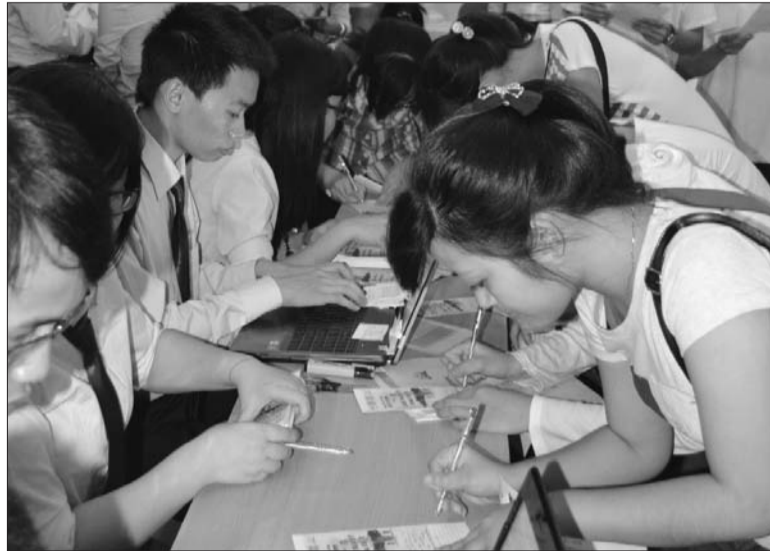
Đăng ký tuyển sinh vào ngành kế toán - kiểm toán Trường Đại học Kinh tế quốc dân

Tiếp tục giữ chỉ tiêu tuyển sinh ổn định đối với ngành kế toán, kiểm toán; mở mới chuyên ngành đào tạo kiểm toán; đào tạo kế toán, kiểm toán tích hợp với ngoại ngữ... là những điểm nhấn nổi bật trong mùa tuyển sinh năm 2019 sắp diễn ra.