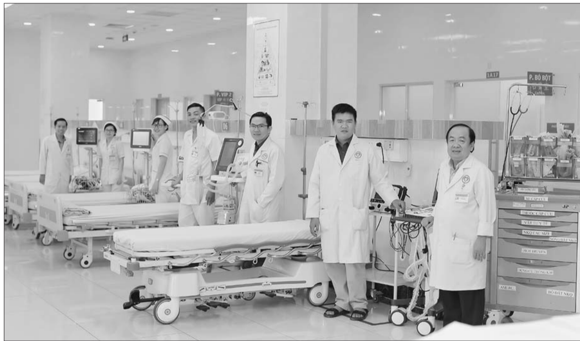
KTNN kiến nghị Bộ Y tế ban hành, sửa đổi, bổ sung nhiều văn bản hướng dẫn thực hiện công tác quản lý TTBYT

Từ những hạn chế, bất cập trong đầu tư, mua sắm, quản lý, sử dụng trang thiết bị y tế (TTBYT), KTNN đã chỉ ra và kiến nghị khắc phục những thiếu sót, hạn chế của Bộ Y tế và các địa phương trong vai trò điều hành, giám sát. Đặc biệt, KTNN đã đưa ra những ý kiến tư vấn đối với Bộ Y tế về ban hành, bổ sung, sửa đổi văn bản hướng dẫn thực hiện công tác quản lý TTBYT.