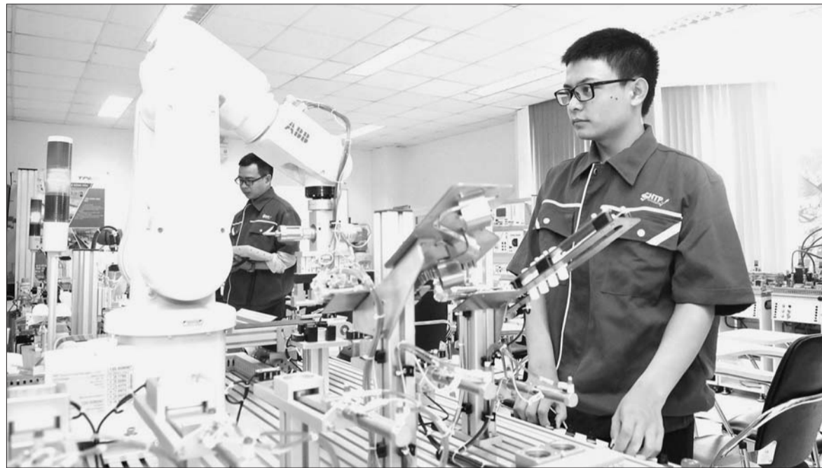
Tốc độ đổi mới công nghệ càng cao, độ trễ chính sách càng lớn

Nhân loại đang chứng kiến sự phát triển mạnh mẽ của Cách mạng công nghiệp 4.0 với đặc trưng là "cá nhanh nuốt cá chậm". Tuy nhiên về mặt quản lý, các chính sách lại luôn có độ trễ, chưa thể theo kịp tốc độ đổi mới của công nghệ. Tốc độ đổi mới công nghệ càng cao, độ trễ của chính sách càng lớn, đối tượng chịu sự điều chỉnh càng chịu nhiều thiệt hại và rủi ro.