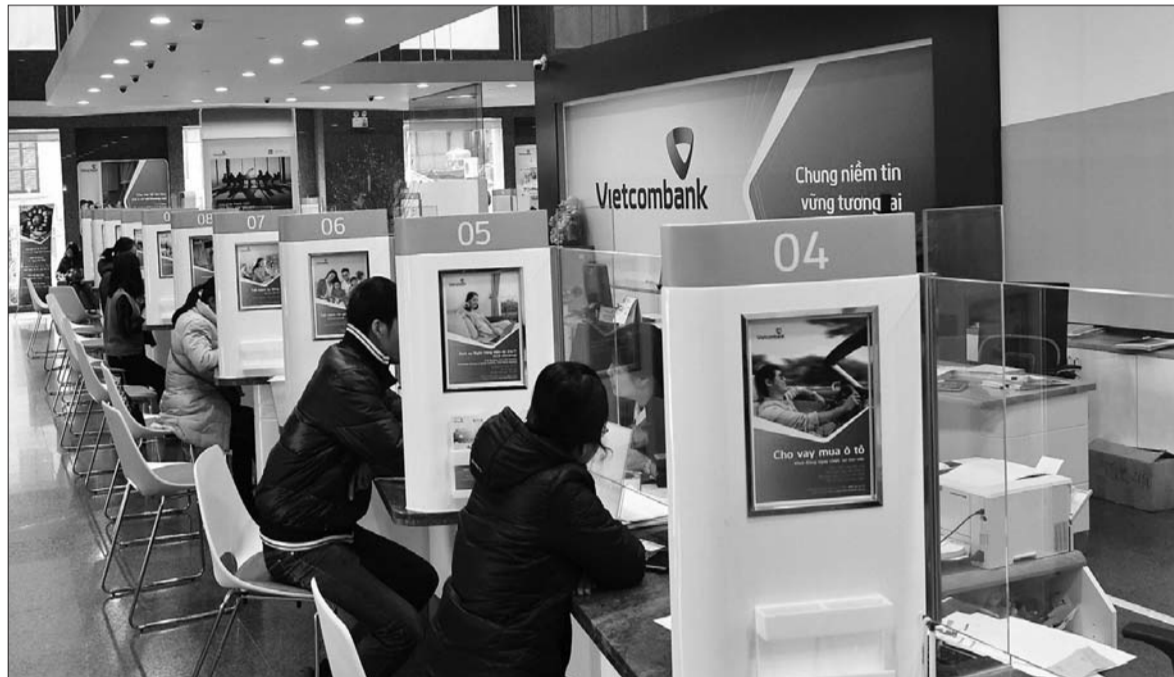
Các TCTD kỳ vọng tình hình kinh doanh năm 2019 tiếp tục được cải thiện

Vượt qua những thách thức của tình hình thế giới và trong nước, năm 2018, ngành ngân hàng đã gặt hái kết quả hết sức tích cực. Theo thống kê của Ngân hàng Nhà nước Việt Nam (NHNN), với kết quả kinh doanh lạc quan trong năm 2018, đa số các tổ chức tín dụng (TCTD) kỳ vọng tình hình kinh doanh năm 2019 tiếp tục được cải thiện hơn.