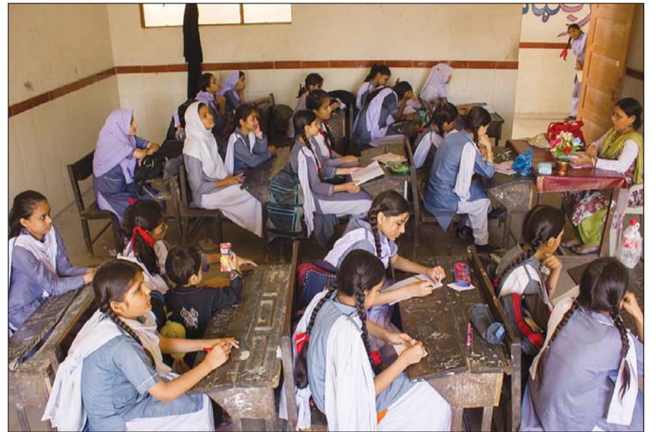
Nạn tham nhũng vẫn nhức nhối trong lĩnh vực giáo dục của Pakistan

Tại Đại học Comsats, các kiểm toán viên cũng chỉ ra nhiều bất thường