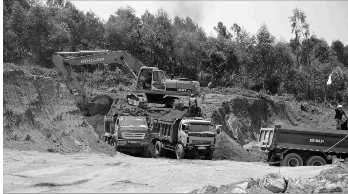
Trong 3 năm, ngành tài nguyên và môi trường đã hoàn thành việc sắp xếp, nâng cao hiệu quả sử dụng 2 triệu ha đất của các công ty nông, lâm nghiệp

Năm 2018, ngành tài nguyên và môi trường đã đạt được những kết quả tích cực, đóng góp quan trọng vào sự phát triển chung của đất nước. Trong đó, dấu ấn nổi bật là việc nâng cao chỉ số tiếp cận, sử dụng bền vững, phát huy hiệu quả các nguồn lực tài nguyên.