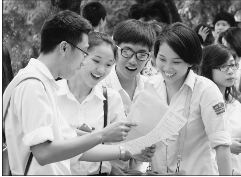
Cơ quan chức năng cần nhanh chóng sửa đổi quy định, để bảo đảm sự tham gia BHYT liên tục và thuận tiện cho HS lớp 12

Việc thực hiện BHYT cho học sinh lớp 12 còn nhiều khoảng trống, khi thời hạn thẻ chỉ có hiệu lực trong năm học mà không tính đến thời gian sau tốt nghiệp của các em. Bất cập này không chỉ ảnh hưởng đến tỷ lệ bao phủ BHYT mà còn ảnh hưởng đến quyền lợi chính đáng của học sinh.