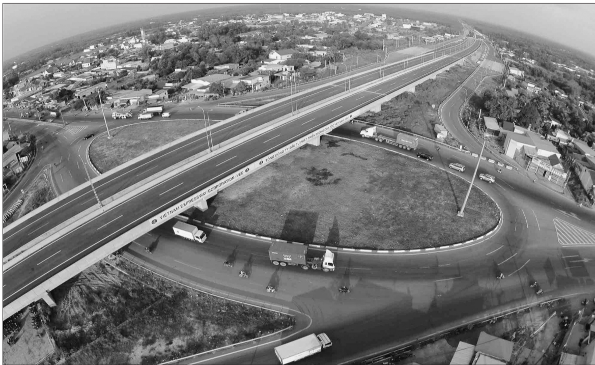
Nhiều hạn chế trong phân bổ và giao kế hoạch vốn đầu tư đã được KTNN chỉ ra

Bên cạnh những bất cập trong công tác xây dựng dự toán chi đầu tư phát triển từ nguồn NSNN dẫn đến thực chi cao mà Báo Kiểm toán đã đề cập ở kỳ trước, kết quả kiểm toán quyết toán NSNN các năm gần đây còn cho thấy những hạn chế trong phân bổ và giao kế hoạch vốn đầu tư phát triển tại một số Bộ, cơ quan T.Ư và nhiều địa phương. Trong đó có nhiều hạn chế đã được KTNN chỉ ra từ năm 2013 (khi kiểm toán quyết toán NSNN năm 2012) nhưng đến năm 2016 (khi kiểm toán quyết toán NSNN năm 2015) vẫn chưa được khắc phục triệt để.