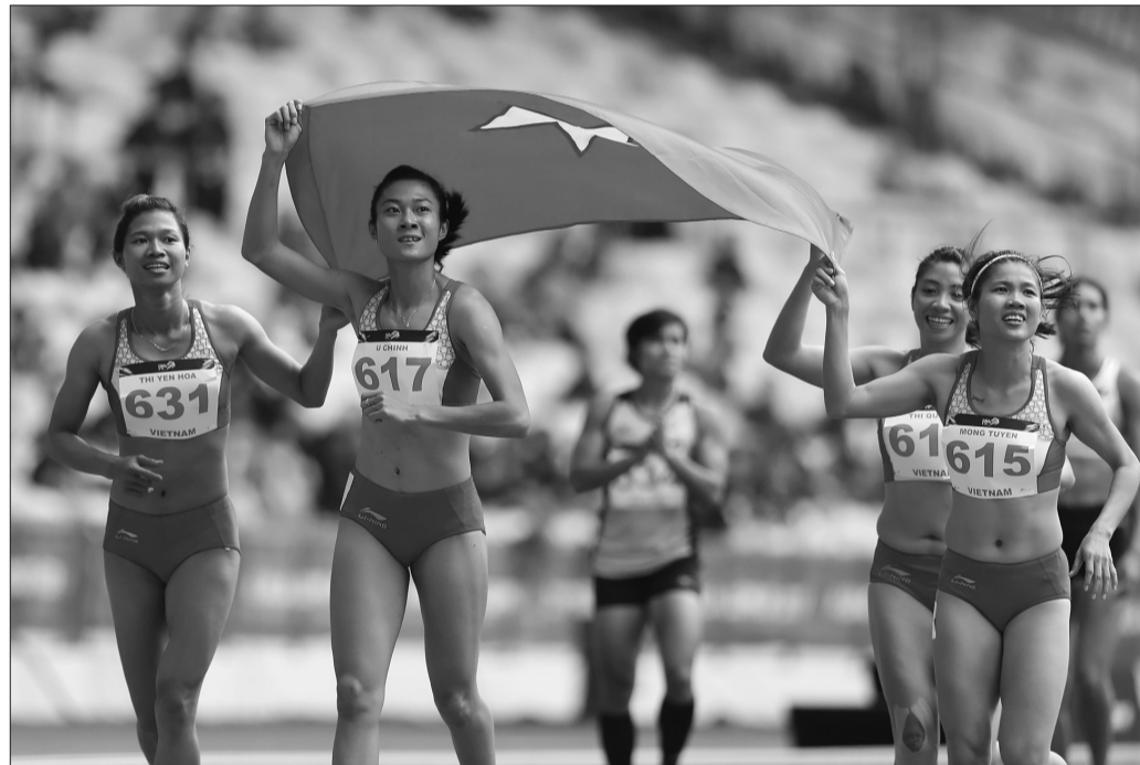
Chế độ dành cho VĐV thể thao cần phải được cải thiện hơn nữa

Cùng với việc chú trọng đầu tư vào các môn thể thao trọng điểm, yêu cầu cải thiện, nâng cao chế độ, chính sách cho các vận động viên (VĐV) là 2 trong số những nội dung đáng quan tâm tại Dự án Luật sửa đổi, bổ sung một số điều của Luật Thể dục thể thao (TDTT).