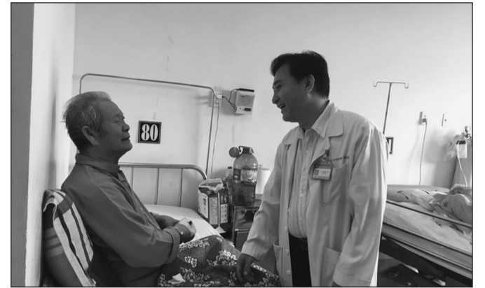
Các bệnh viện cần phát triển hệ thống khoa Lão khoa để đáp ứng nhu cầu chăm sóc sức khỏe của người cao tuổi

Thực tế, hệ thống cơ sở chăm sóc sức khỏe người cao tuổi đã được hình thành và phát triển từ Trung ương cho tới địa phương, với nhiều mô hình chăm sóc dựa vào cộng đồng đã được nhân rộng. Tuy nhiên, hệ thống chăm sóc sức khỏe cho người cao tuổi chưa bắt kịp sự chuyển đổi nhân khẩu học mạnh mẽ này. Mạng lưới y tế chăm sóc sức khỏe người cao tuổi chưa phát triển, số nhân viên y tế phục vụ tại cộng đồng vừa thiếu về số lượng, vừa yếu về nghiệp vụ, kỹ năng. Hiện cả nước chỉ có 49 trong số 63 bệnh viện tỉnh, thành phố có khoa Lão, 3 cơ sở đào tạo bộ môn Lão khoa.