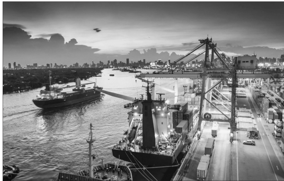
Việt Nam đã có nhiều đóng góp quan trọng cho hợp tác kinh tế ASEAN trong thời gian qua

Vừa qua, Hội nghị Bộ trưởng Kinh tế ASEAN lần thứ 49 (AEM 49) và các hội nghị liên quan gồm Hội nghị Hội đồng Khu vực thương mại tự do ASEAN lần thứ 31, Hội nghị liên Bộ trưởng Kinh tế ASEAN và Hội đồng Khu vực đầu tư ASEAN lần thứ 20, các hội nghị tham vấn giữa ASEAN và 10 đối tác, Hội nghị Bộ trưởng Hiệp định đối tác kinh tế toàn diện khu vực (RCEP) lần thứ 5... đã diễn ra tại Philippines.