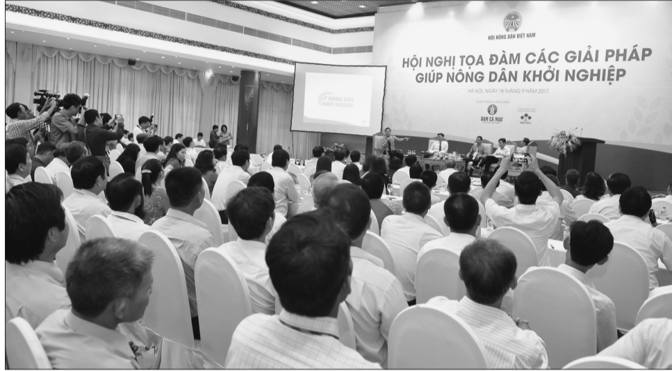
Đông đảo người dân và DN quan tâm đến dự Hội nghị

Trung ương Hội Nông dân Việt Nam vừa phối hợp với Bộ Khoa học và Công nghệ (KH&CN) tổ chức Tọa đàm “Các giải pháp giúp nông dân khởi nghiệp”. Tại Tọa đàm, các chuyên gia và đại diện một số mô hình khởi nghiệp đã thảo luận, đưa ra những khuyến nghị về chính sách nhằm hỗ trợ nông dân khởi nghiệp.