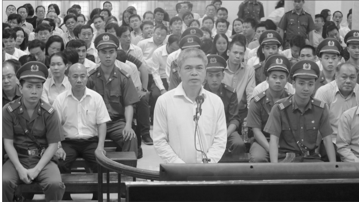
Nhiều vụ án tham nhũng đã và đang được xử lý nghiêm, được dư luận nhân dân đồng tình hưởng ứng