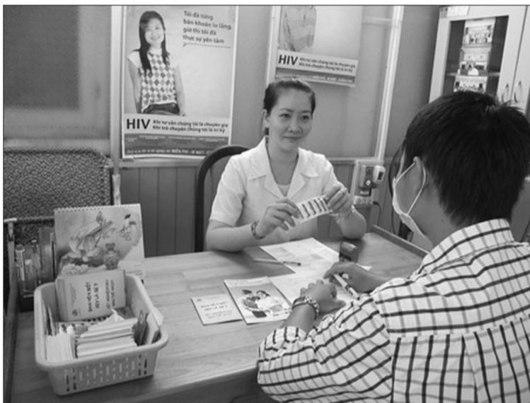
Bệnh nhân HIV/AIDS sẽ được Quỹ BHYT thanh toán trong khám, chữa bệnh và sử dụng thuốc ARV

Trong bối cảnh nguồn viện trợ nước ngoài cho công tác phòng, chống HIV/AIDS ngày càng giảm dần, Bộ Y tế đang xin ý kiến Dự thảo sửa đổi Thông tư số 15/2015/TT-BYT hướng dẫn khám, chữa bệnh Bảo hiểm y tế (BHYT) đối với người nhiễm HIV/AIDS và người sử dụng dịch vụ y tế liên quan đến khám, chữa bệnh HIV/AIDS, nhằm sửa đổi, bổ sung, khắc phục những bất cập, đảm bảo nguồn lực tài chính cho công tác phòng, chống HIV/AIDS.