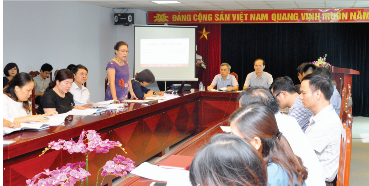
Toàn cảnh Tọa đàm

Nhằm xác định rõ hơn vai trò của KTNN trong việc đánh giá hiệu quả tái cơ cấu ngân hàng và kiểm soát, xử lý nợ xấu, sở hữu chéo, làm cơ sở cho việc xây dựng Kế hoạch kiểm toán thời gian tới, chiều 18/9, Tọa đàm “Nợ xấu và sở hữu chéo tại các tổ chức tín dụng (TCTD) và vai trò của KTNN” đã diễn ra dưới sự đồng chủ trì của đại diện lãnh đạo KTNN chuyên ngành VII và Trường Đào tạo và Bồi dưỡng nghiệp vụ kiểm toán. Tham dự Tọa đàm có 54 đại biểu là công chức, viên chức, Kiểm toán viên nhà nước đến từ các đơn vị trực thuộc KTNN.